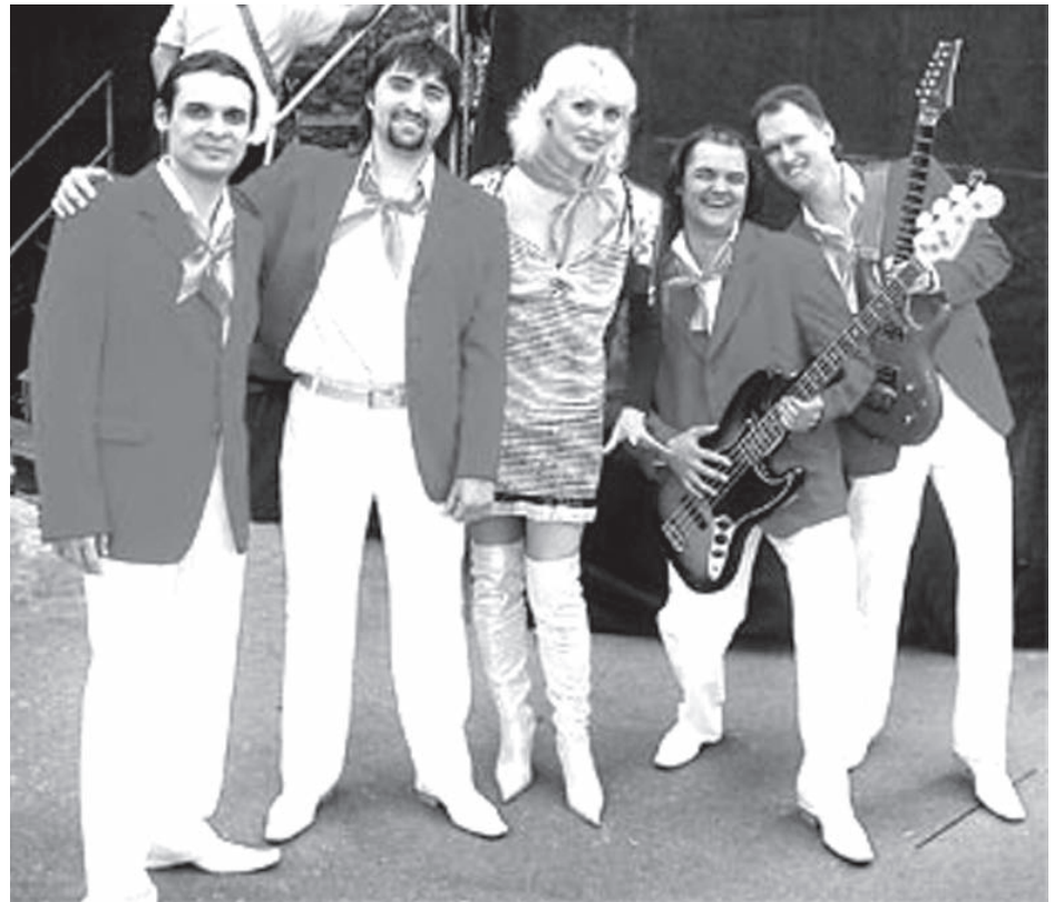
Действующий состав группы «Здравствуй, песня!»