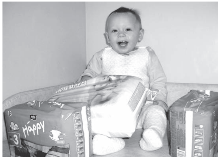
Малыш в ожидании новых подарков