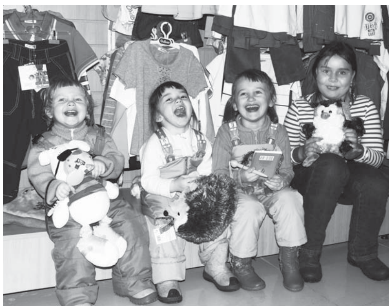
«Гудвин» ждёт маленьких покупателей и их родителей посетить сказочную страну с 10.00 до 19.00 ежедневно (в воскресенье – до 18.00)

Магазин расположен по адресу: Верхняя Салда, ул. Сабурова, 7, ТЦ «Монетка», 2 этаж. ПРИ ССЫЛКЕ НА СТАТЬЮ СКИДКА 5%. Ваш «Гудвин».