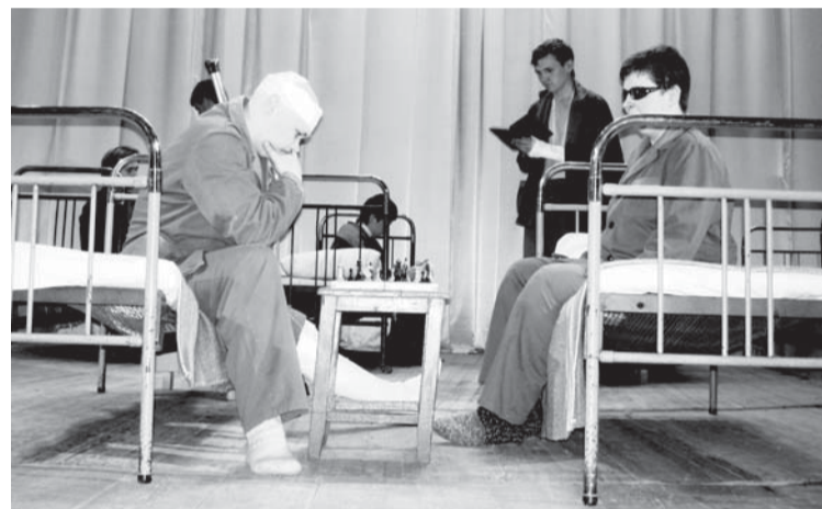
Война изменила всё: мысли, жизнь, время

исход боя, за жизнь вверенных им людей, многие из которых годились им в отцы. Вот таким храбрым, верным офицерской чести лейтенантом является главный герой спектакля Владимир Третьяков. Он для зрителей становится обобщенным образом того поколения. Размышления Володи трогают до глубины души: