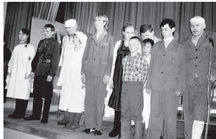
Салдинские артисты прожили жизнь своих ровесников

- Одна и та же мысль не дает мне покоя: Неужели когда-нибудь окажется, что этой войны могло бы не быть? Что в силах людей было предотвратить это? И миллионы бы остались живыми? Неужели и мысль