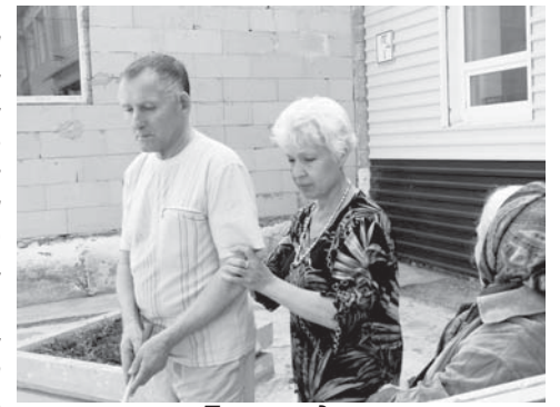
Плохо видящим помогают ориентироваться

Удивительно, но все больше и больше стало здесь иногородних. Центр должен обслуживать любых пожилых людей, инвалидов или попавших в трудные жизненные ситуации со всей Свердловской области. Слухи же о его престиже разносятся быстро в Свободном и Тагиле. Может случиться, что салдинцам, на чьей территории он находится, за подобными услугами придется выезжать в другие