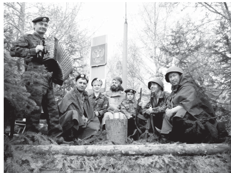
Экспозиция «На привале»