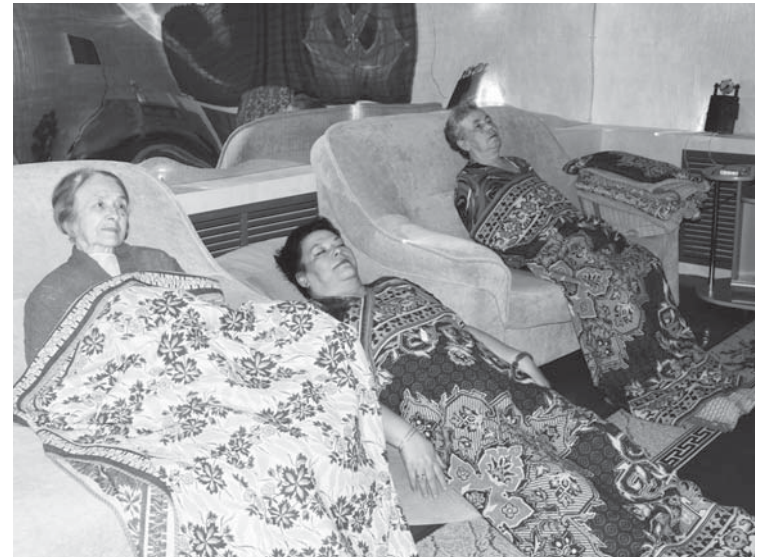
В комнате психологической разгрузки