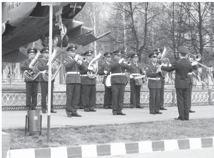
Невозможно представить парад без военного оркестра