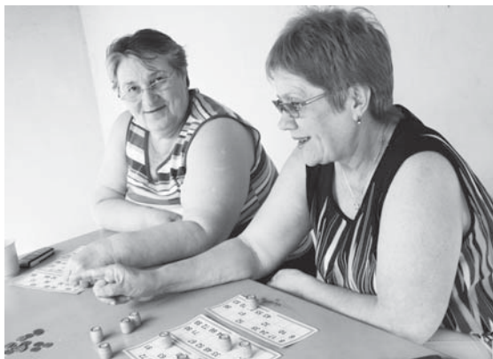
Тагильские женщины любят салдинский центр