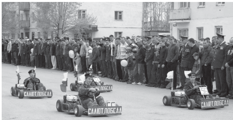
Юные картингисты станции «Юный техник»