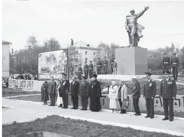
Вечная память и слава тем, кто не дождался светлого Дня Победы