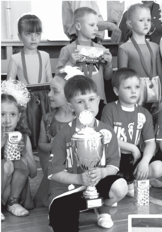
Долгожданный победный кубок

13 мая в спортивном зале Дома культуры Российской армии в ЗАТО Свободный прошел большой спортивный праздник - II этап Всероссийского физкультурно-оздоровительного фестиваля «Дети России образованны и здоровы» среди воспитанников дошкольных учреждений нашего городка.