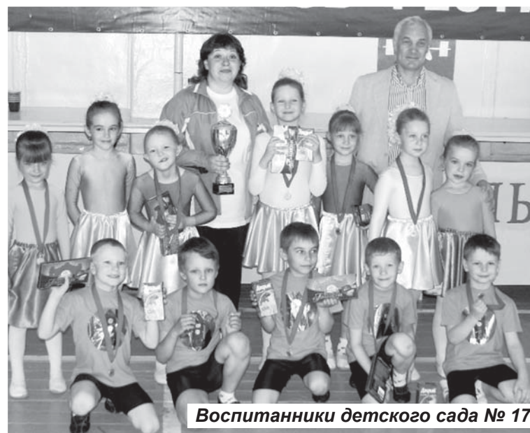
Воспитанники детского сада № 17

специалист по информационной политике и связи с общественностью