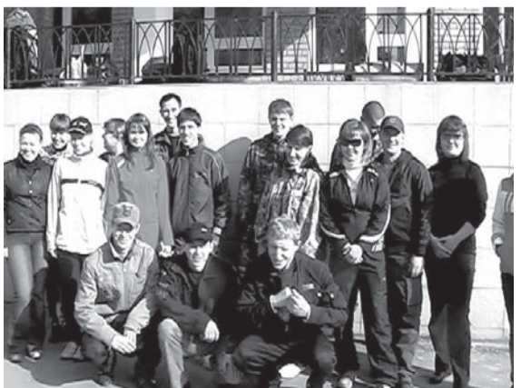
Публикации подготовила Наталья НИГАМЕДЬЯНОВА