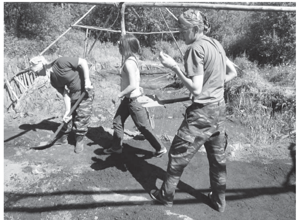
Первый день работы в раскопе