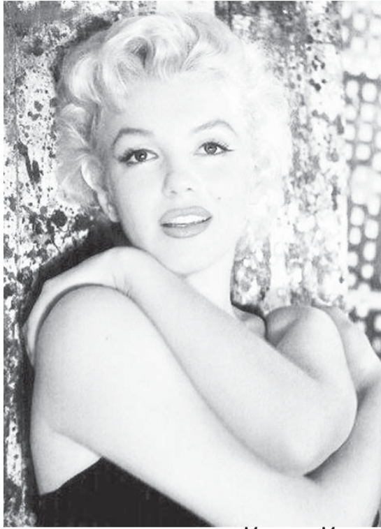
Мэрилин Морло - пример для подражания в 60-х

Вкусная еда и красивая спортивная фигура. Совместимы ли эти понятия? Что на самом деле побеждает и чем чревата эта победа? Вам предлагаются два мнения людей разного поколения, разного отношения к внешнему виду женщины. Что думают об этом женщины и что думают об этом мужчины?