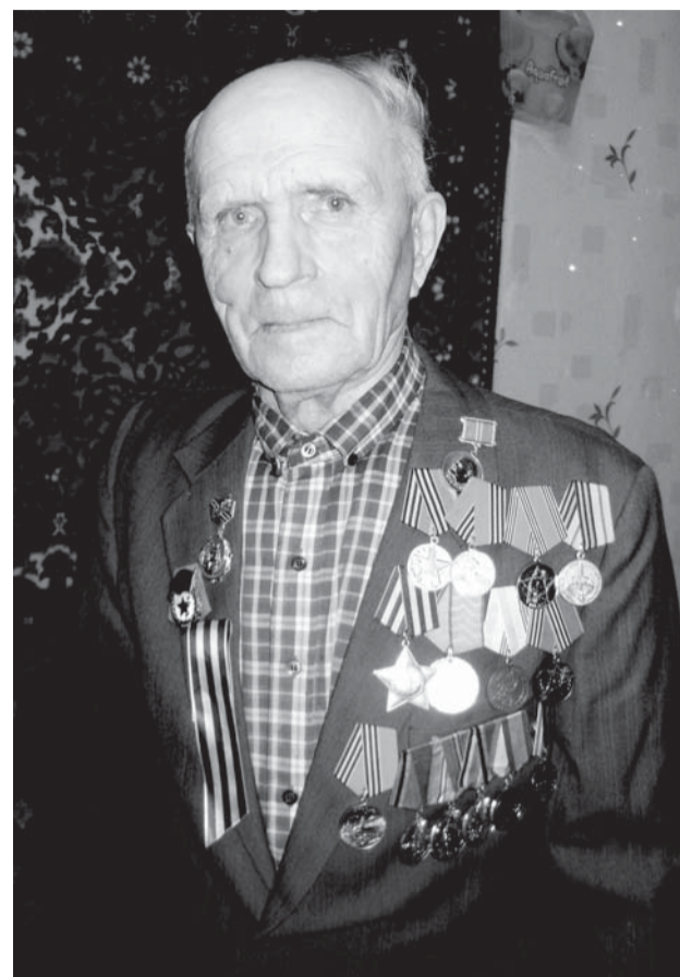
Январь 2010 г. Верхняя Салда

- Все еще с потолка капает. На стенах обои вспучило. А нам уже документ дали, где написа-