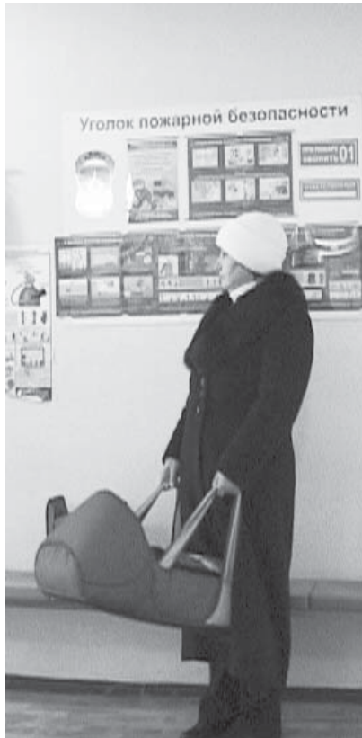
Вторник и четверг - «дни здорового ребенка»

И сами медики, имеющие несовершеннолетних детей, в таком же поло-