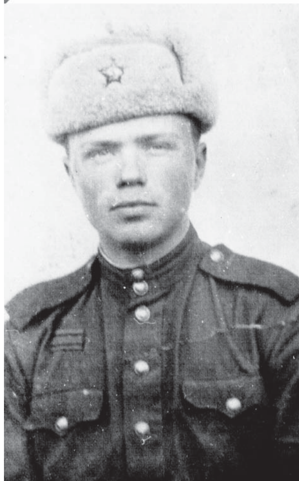
18 лет. апрель, 1945 г. На Одере