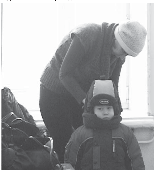
На приём к врачу

Уже в январе 2010 года выплата пенсий инвалидам будет произведена в зависимости от группы инвалидности, а не от степени ограничения трудоспособности.