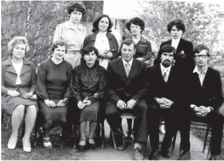
Педагогический коллектив ДМШ в 80-е годы