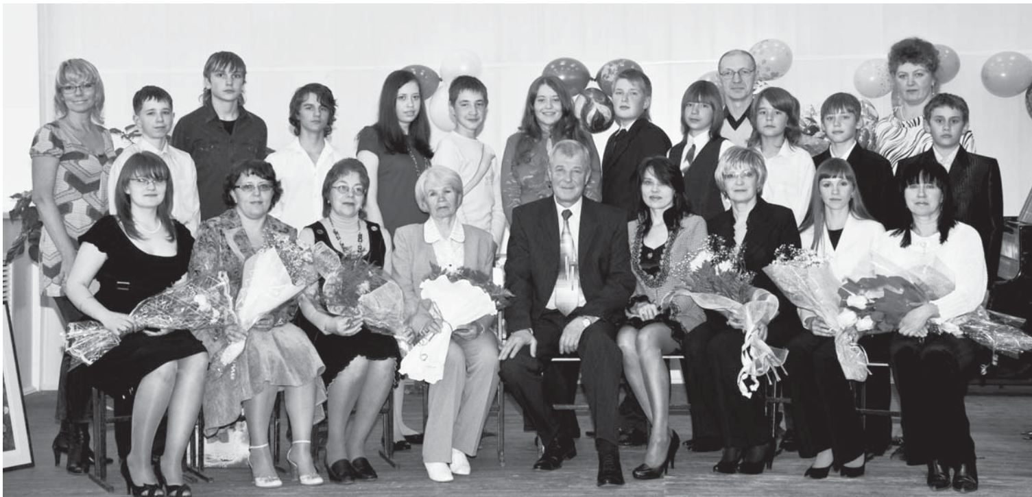
Народное отделение: выпускники и преподаватели. 2008 год.