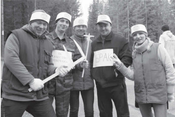
Контролеры ОТК брака не допустят

Спортивная игра «Зарница» пришла в Россию из пионерского прошлого и сегодня остается востребованной, вызывая интерес у участников. Правда, она претерпела некоторые изменения. 17 марта на горе «Мельничная» молодежная организация ВСМПО провела игру «Зарница» для молодежи цехов завода. Заявились на участие 17 команд. В каждой – по