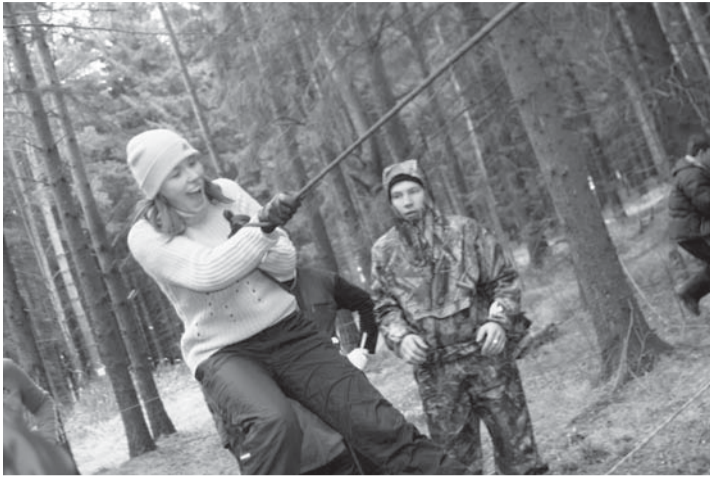
Переправа легка только на первый взгляд