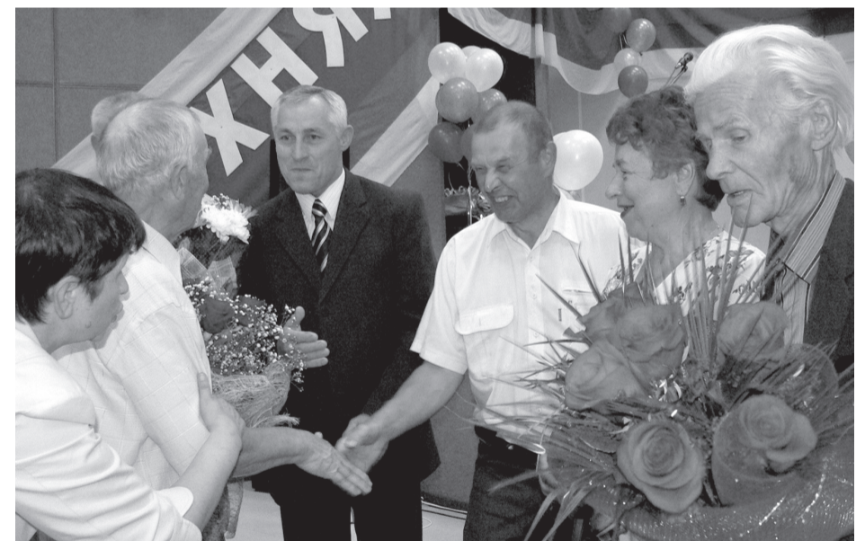
Поздравление Леонида Неверова в День города