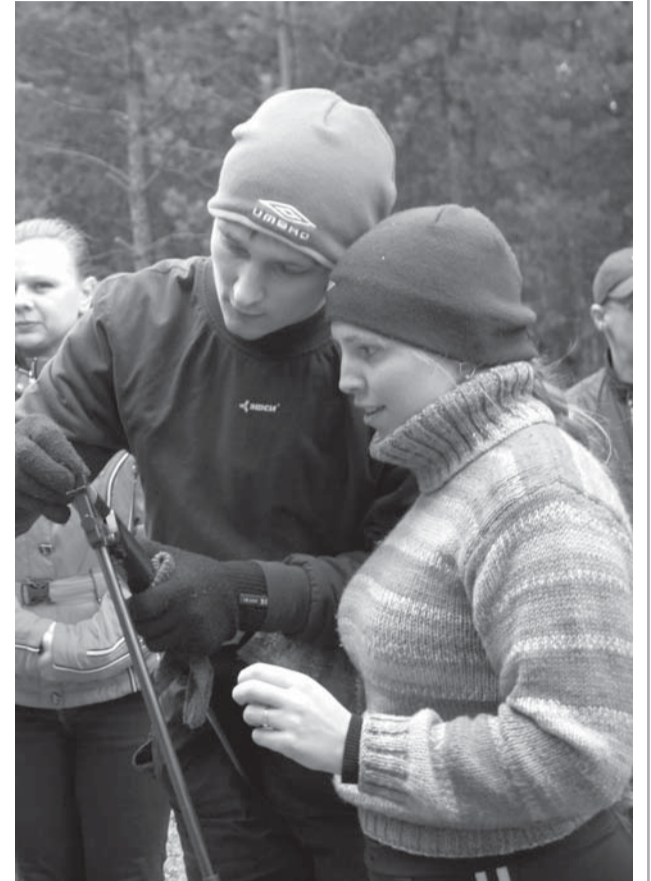
На одном из этапов