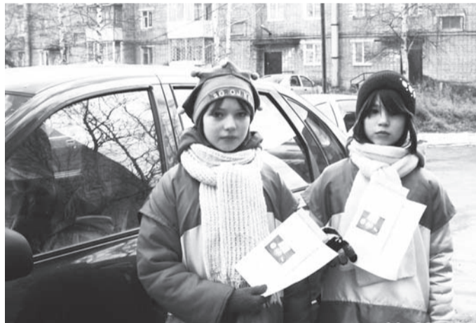
Водитель, получи письмо

Третьего ноября в рамках проведения первоочередных мероприятий, посвященных Всемирному дню памяти жертв ДТП, инспекторами по пропаганде ДПС ГИБДД ОВД по Верхнесалдинскому городскому округу, ГО Нижняя Салда совместно с инспекторами ДПС, воспитанниками ДОУ № 26 «Дюймовочка» у д. 2 (ул. Воронова) возле нерегулируемого пешеходного перехода организована и проведена социальная акция «Зебра». Цель - являлось повышение безопасности пешеходов. В ходе акции инспектора по пропаганде и инспектора ДПС переводили детей через проезжую часть дороги по нерегулируемому пешеходному переходу, провели профилактические беседы по соблюдению ПДД пешеходами. В конце акции детям были вручены по одному экземпляру газеты «Добрая дорога детства».