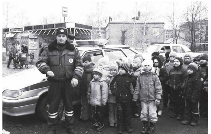
Мы учим Правила дорожного движения