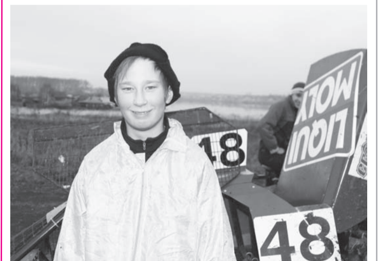
Материалы 12 и 13 страниц подготовила Ирина ЛУЧНИКОВА

Если все это сосчитать, то такой популярный в 80-е годы вид спорта стал недоступен для большинства любителей этого вида соревнований в наше время. Этим ребятам просто повезло – их родители находят возможность и желание поддерживать спортивные успехи своих детей.