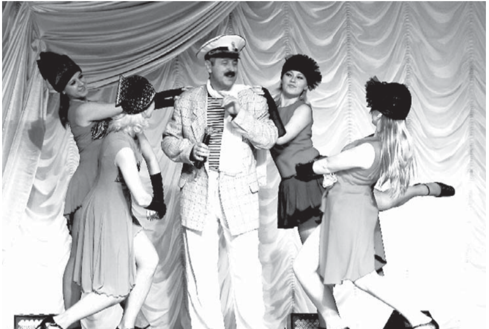
Концерт на сцене Дворца

Природная интуиция и эстетический вкус помогают парикмахеру в работе, но для становления настоящего профи