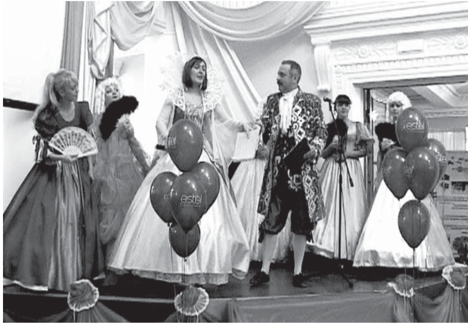
Открытие фестиваля «Салдинский цирюльник»