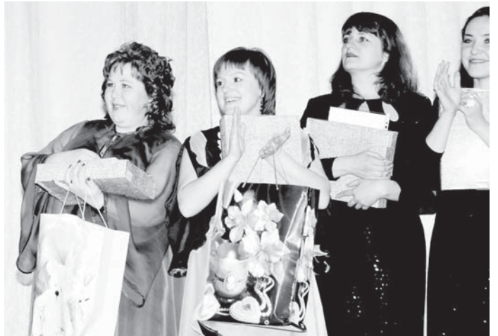
Страх выступлений позади, в руках - подарки, в глазах - счастье и радость