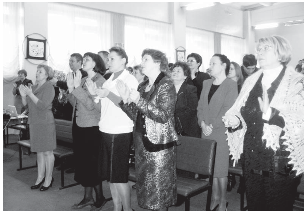
Школьный гимн пели стоя