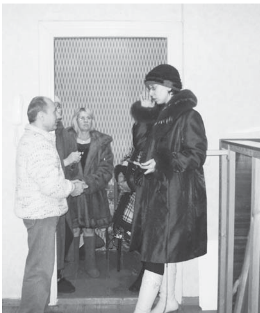
Жильцы настроены решительно

Только успело в газете «Орбита+ТВ» выйти сообщение о том, что коммунальщики приступили к ликвидации аварии, как позвонили жильцы и рассказали о последствиях. Оказывается, их беды не закончились, а проблем стало еще больше.