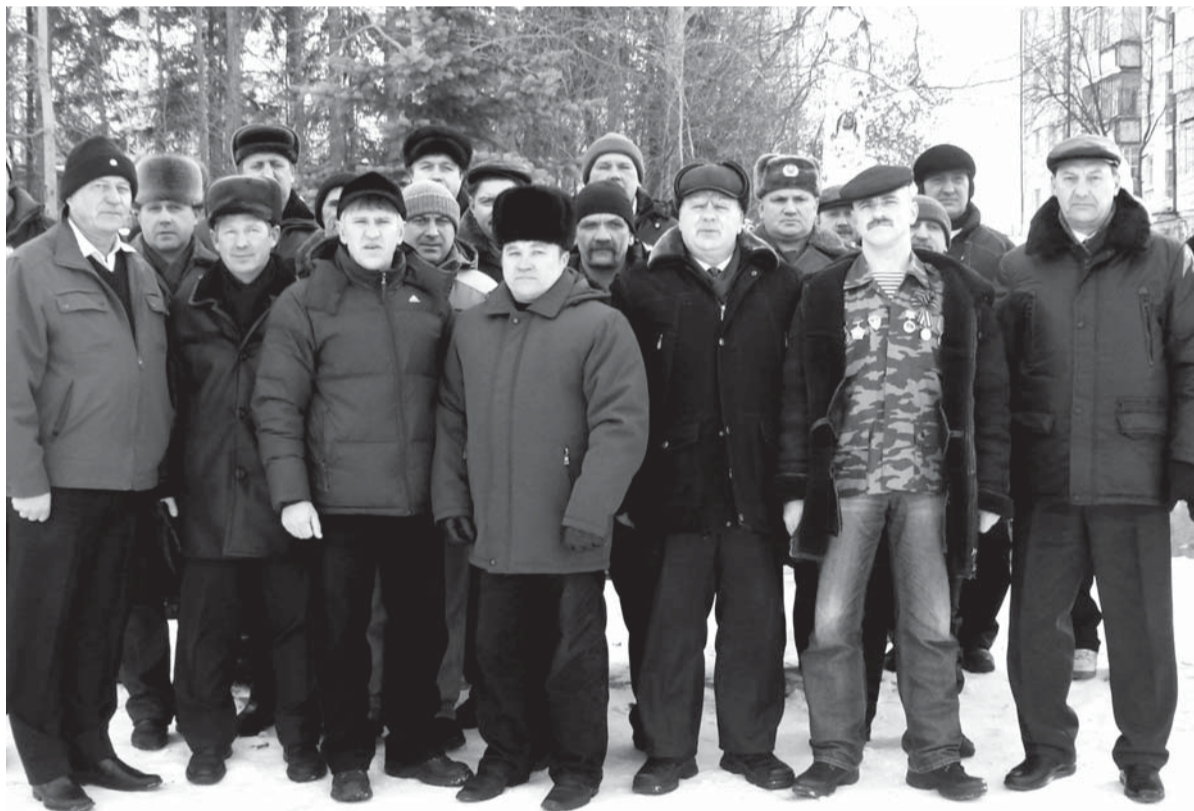
На снимке: участники митинга

Пожалуй, на земле никогда не наступит такое время, когда слово «солдат» станет забытым. Войны на нашей планете не прекращаются с древних времен. Сегодня, в год 65-ой годовщины нашей Победы в Великой Отечественной войне, мы вспоминаем те страшные дни, но, к сожалению, забываем о том, что была ещё одна война - в Афганистане. Официально не объявленная, но героическая и трагическая, она оказалась в два раза продолжительней, чем Великая Отечественная.