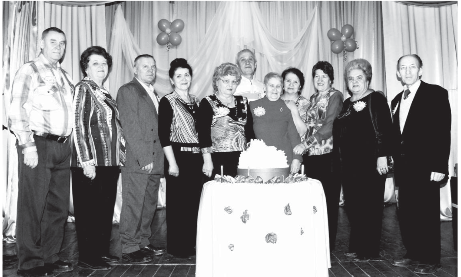
На школьный юбилей пришли первые выпускники

В этот день на сцену вышли первые выпускники. Когда-то они представляли смешанный класс, собранный в школу № 3 из других образовательных учреждений. Но они быстро сдружились и уже 46 лет собираются вместе на вечерах встреч, считают именно эту школу родной. Были на сцене учителя: ветераны и новички, выпускники прошлых лет и те, кто сегодня считает эту школу своей, а еще было много слов благодарности, песен и танцев. Пока шел концерт, каждый в зале думал о своем, вспоминал самые дорогие для него моменты, оценивал, что школа дала именно ему.... И сегодня свои воспоминания публикуют первые перwokлассники школы №3.