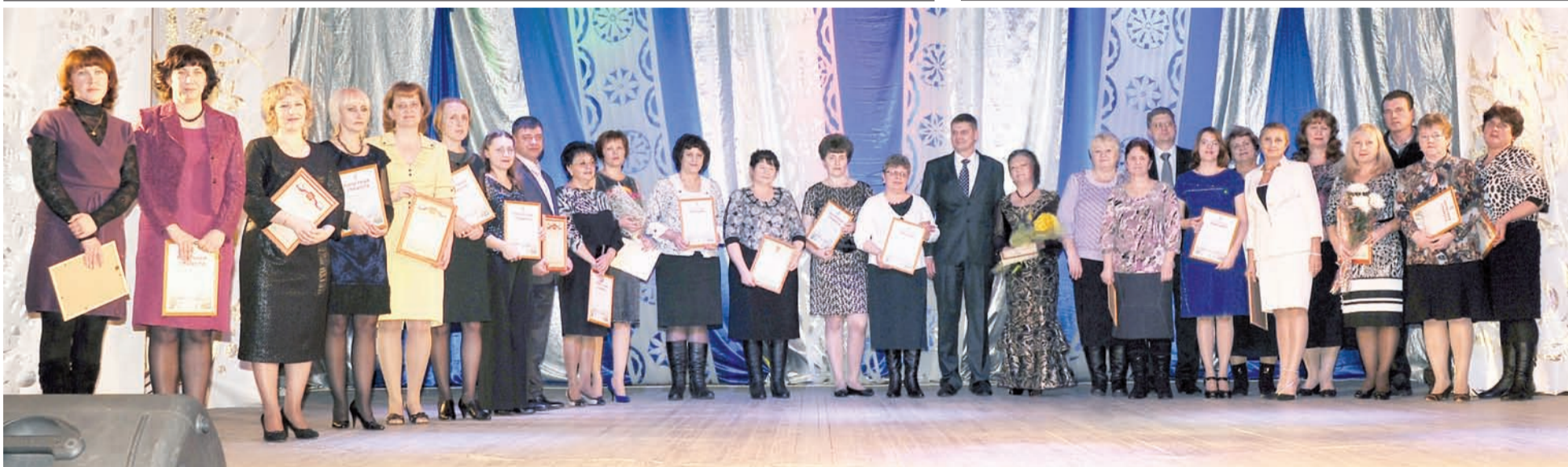
Награды и подарки лучшим