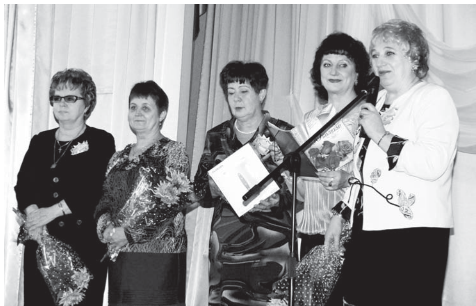
Первые первоклассники школы № 3