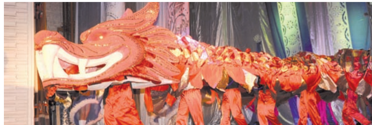
Символ года - Дракон

в современной обработке, новая и очень интересная постановка танцевального коллектива «Остров танца», вокальные номера, выход на сцену символа года - Дракона, всего и не перечислить. Вели программу четыре стихии - Земля, Огонь, Воздух и Вода и, конечно же, Дедушка Мороз. Программа - то новогодняя! Конечно же, была борьба: кто из них лучше, но благодаря справедливому и мудрому Деду Морозу все