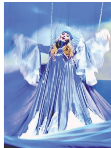
Дарина Гарипова с новой песней