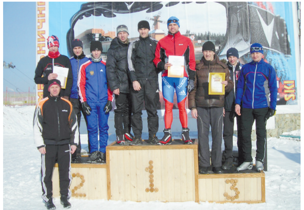
Команды призёры: у мужчин 1 место-цех 16, 2 место - 38 цех, 3 место - 32 цех