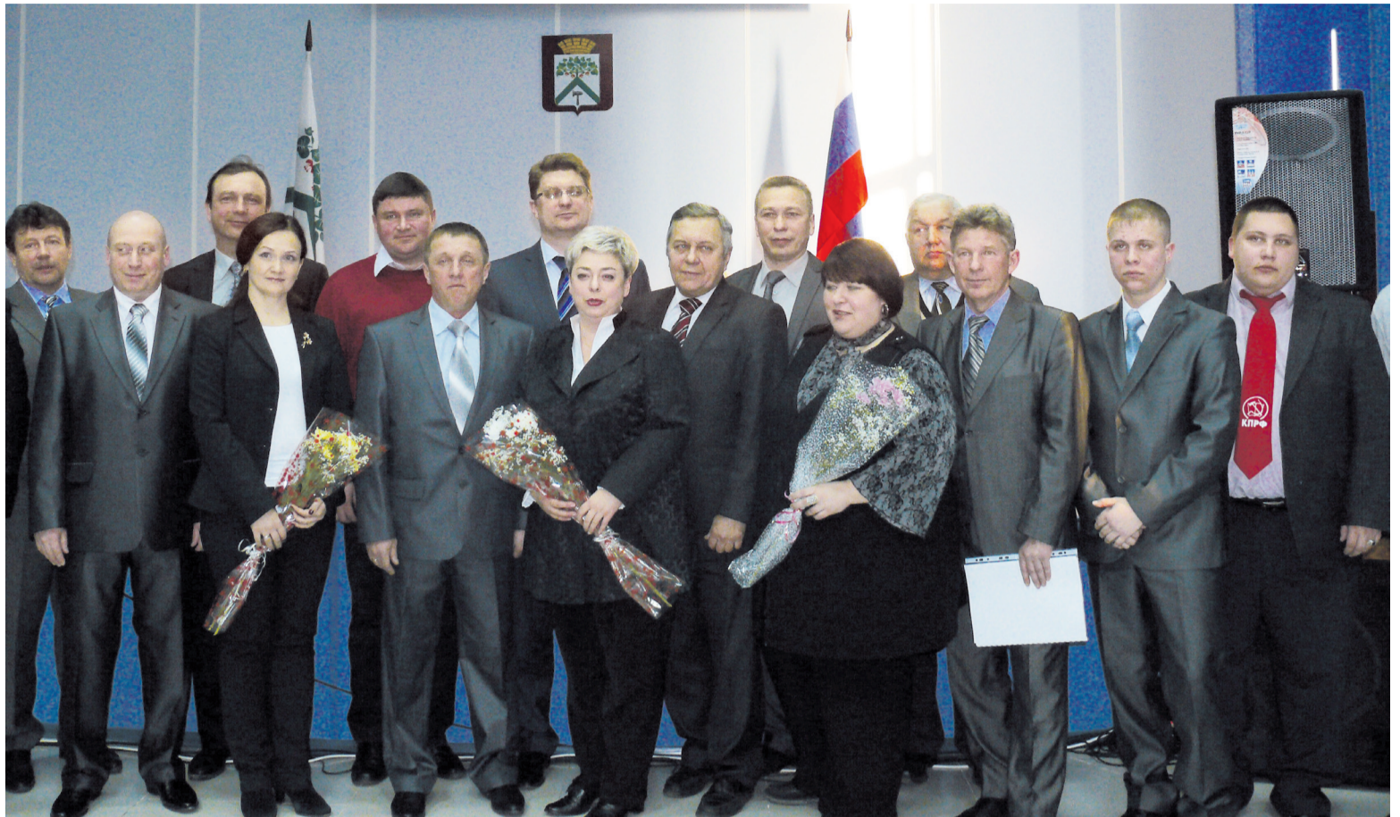
Новый состав Думы городского округа после вручения депутатских удостоверений

Подготовку и проведение выборов осуществляли Верхнесалдинская районная территориальная избирательная