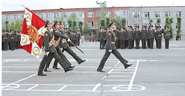
Пермский военный институт ВВ МВД России

Во все века силой, способной объединить и сохранить нашу землю, оставались Вооруженные Силы.