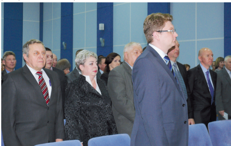
Звучит Гимн России

За работу, господа депутаты! Салдинцы ждут от вас существенных преобразований во всех сферах жизни городского округа. Не ведите избирателей, отдавших за вас свои голоса.