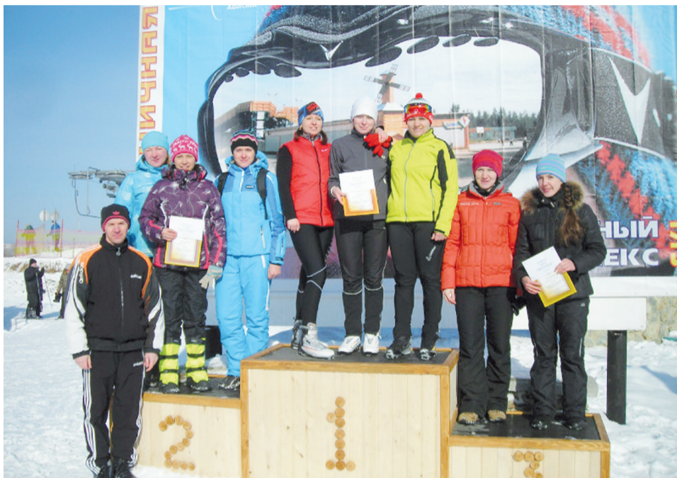
Команды призёры: у женщин 1 место - 10 цех, 2 место - 51 цех, 3 место - 32 цех