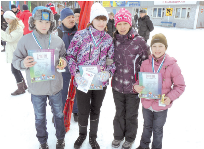
Аня с тренером и друзьями по лыжной секции