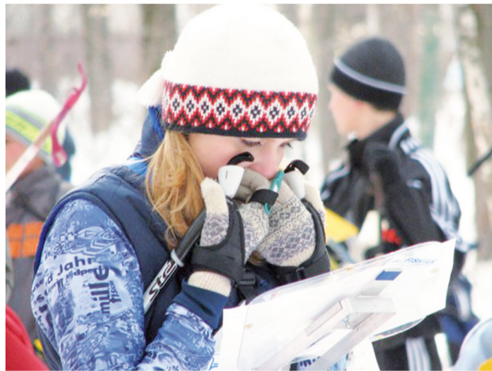
Что тут на карте?

В предместье турбазы «Хрустальная» 18 марта состоялся четвертый тур первенства Свердловской области по ориентированию на лыжах на маркированной трассе. Спортсменам следовало не только быстро пробежать дистанцию (это само собой), но и правильно нанести точки контрольных пунктов на карту. В случае ошибки к беговому времени добавлялась штрафная минута за каждый неверно нанесенный на карту контрольный пункт. Опытные участники состязаний знают эти условия, но промахи от волнения случаются.