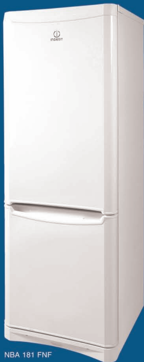
NBA 181 FNF

ул. Энгельса, 87/1 (ТЦ «Седьмой континент»)