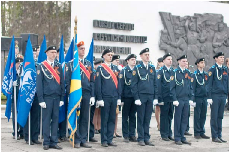
Кадеты в почетном карауле

к памятнику заводчанам, внесшим свой трудовой вклад в победу над фашистской Германией. Красочно украшенная воздушными шарами колонна участников шествия – ветеранов войны и труда, родителей с детишками на руках и в колясках, учителей, школьников и студентов - медленно направляется в парк Труда и Победы – к Мемориалу павшим на полях сражений салдинцам. Вот отзвучал Гимн России, и ведущая представляет слово ораторам.