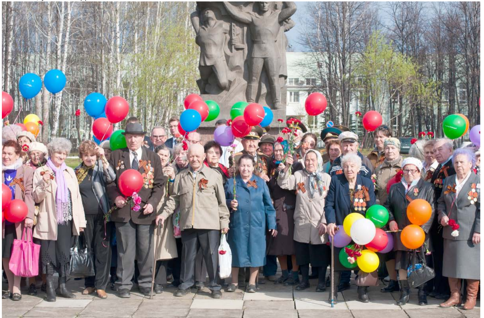
Фотография на память о 67-ой годовщине Победы