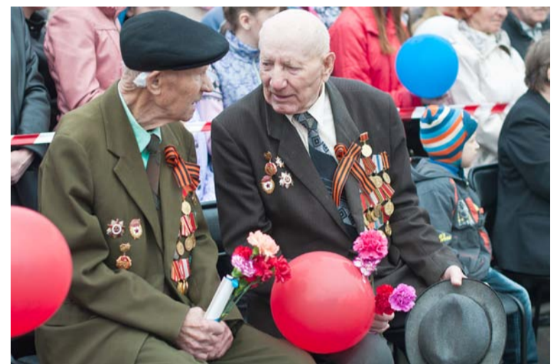
«Бойцы вспоминают минувшие дни»