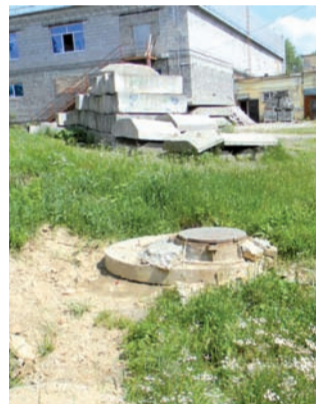
Блоки не на месте