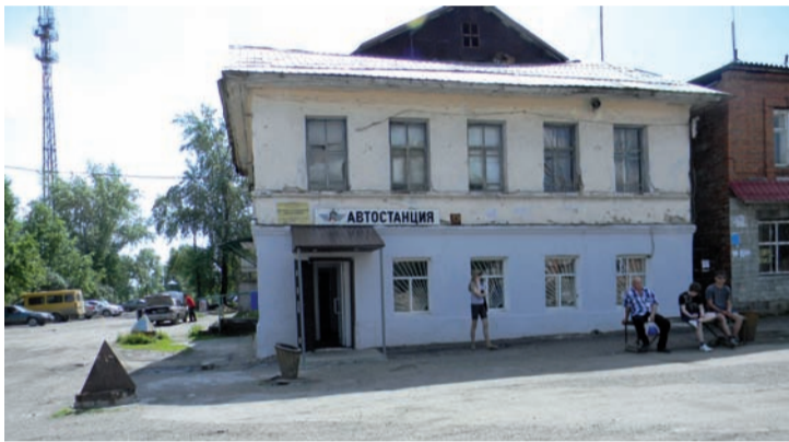
Автостанция - позор города