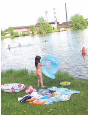
«Я учусь плавать»