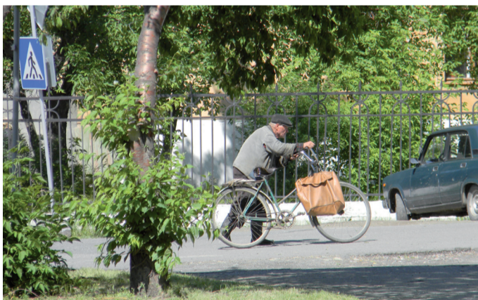
Ветеран соблюдает ПДД