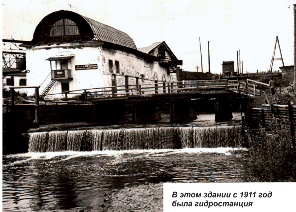
В этом здании с 1911 год была гидростанция

На Верхнесалдинском заводе построена плющильная машина для