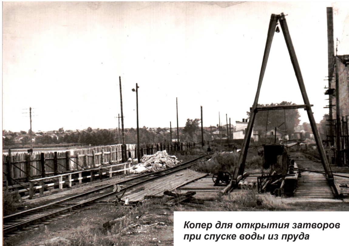
Копер для открытия затворов при спуске воды из пруда

7 декабря общим собранием акционеров была утвер-