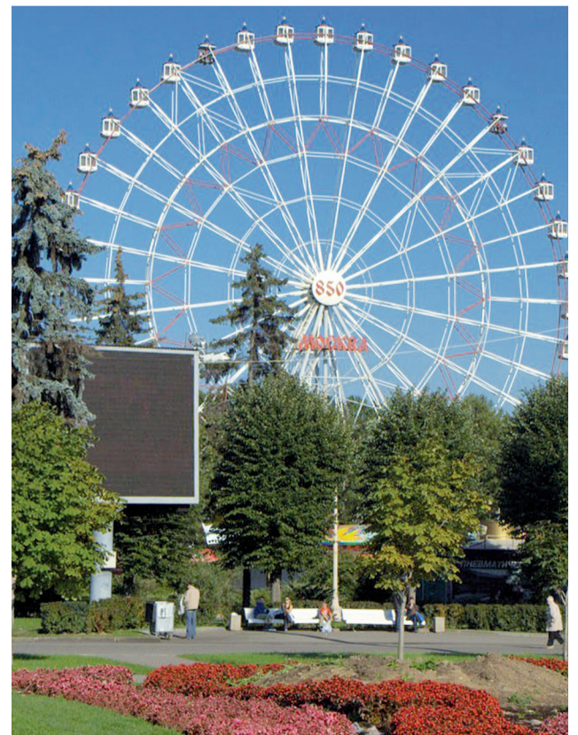
Самое высокое колесо обозрения в России (ВДНХ)