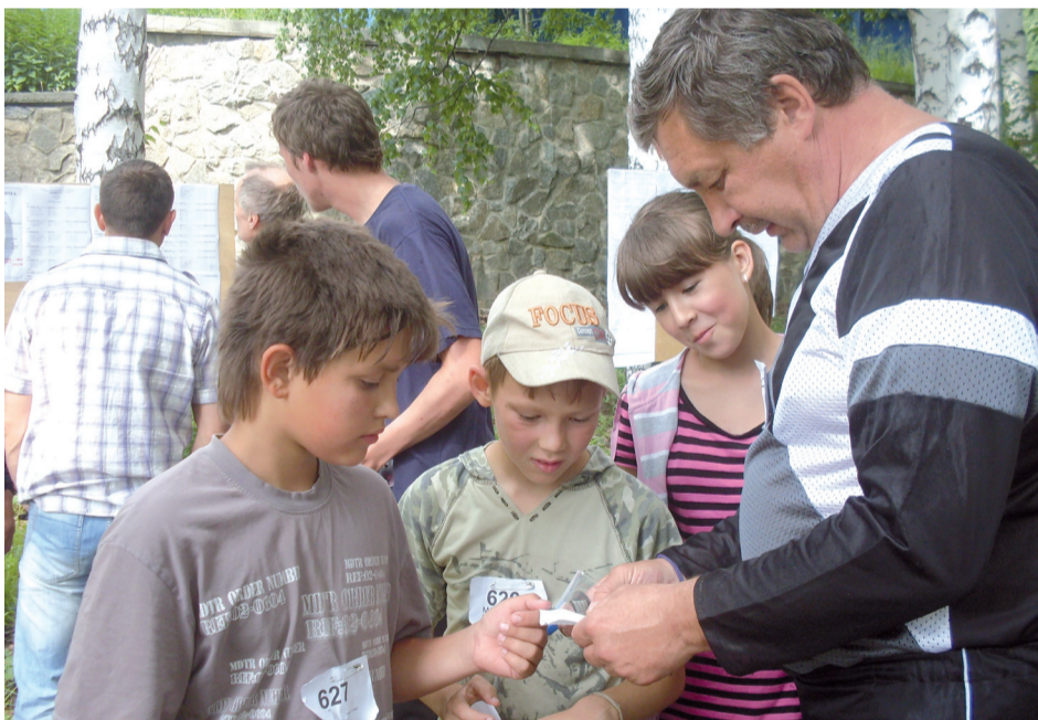
Наставления юным ориентировщикам перед стартом