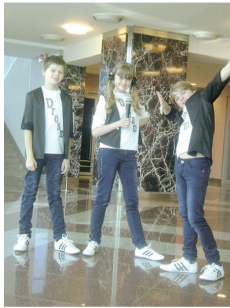
Вокально - эстрадный ансамбль «Радуга»