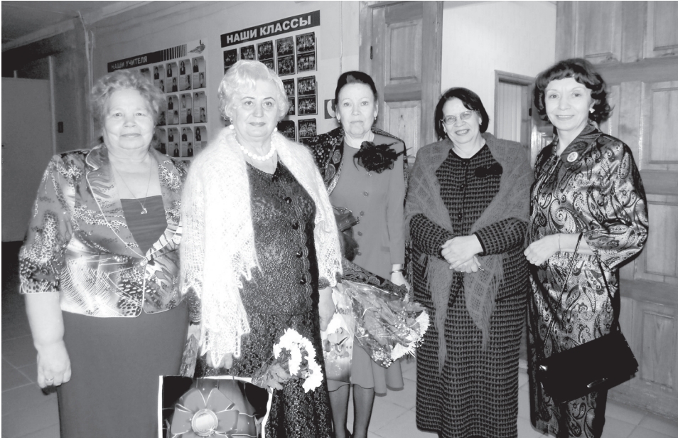
А накануне Нового года 40-летие отметил коллектив школы №14.

Юбилей учебных учреждений городского округа стали знаковыми событиями в нашем городском округе. Семьдесят лет исполнилось Верхнесалдинскому многопрофильному техникуму им.А.Евстигнеева, шестидесятилетие отметила Верхнесалдинская школа искусств, пятидесятилетие отпраздновала общеобразовательная школа №3, недавно исполнилось 30 лет со дня открытия школы №2.