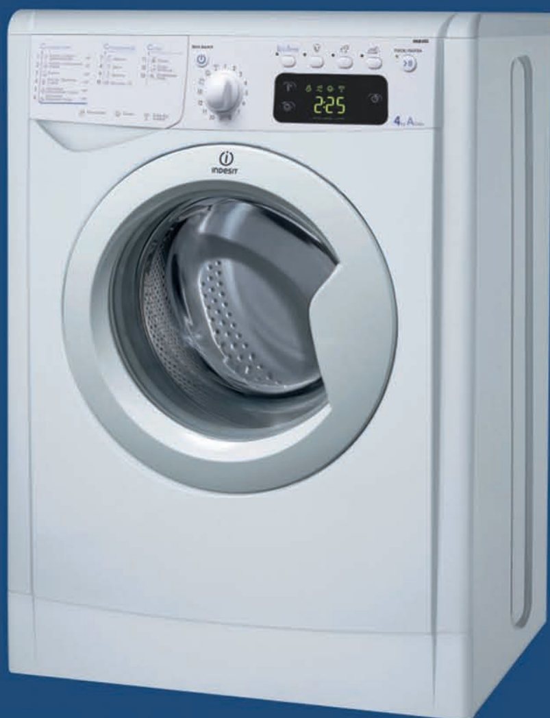
IWUE 4105 (CIS)

Верхняя Салда, Энгельса, 87/1 (ТЦ «Седьмой континент»)