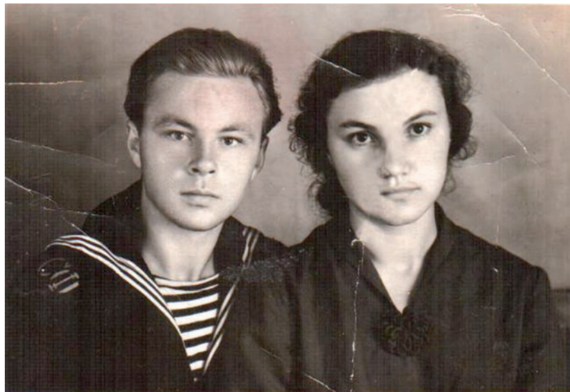
Жених и невеста

внимания. Улыбчивый. Веселый. Ухаживал красиво. Цветы дарил. А как-то я заикнулась, что мне лилии из нашего пруда очень нравятся, так он на следующий день принес мне их целую охапку. Ну как в такого не влюбиться! С детских лет ему нравился баян старшего брата. Сколько оплеух он от него получал, но все равно научился играть и после седьмого класса устроился работать в Дом культуры баянистом. Зимой мы встречались редко. Я