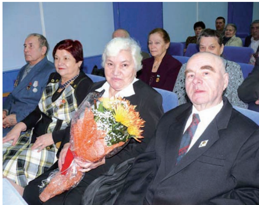
52 года вместе