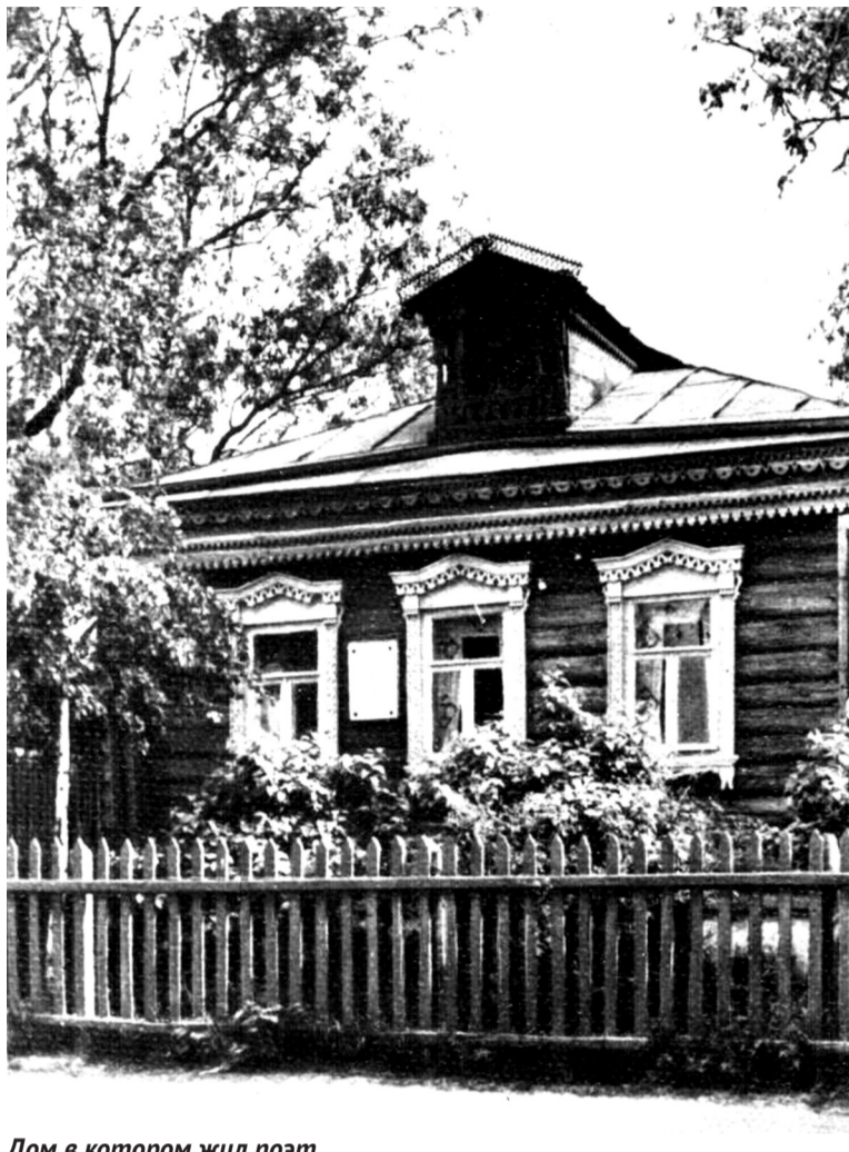
Дом в котором жил поэт

Показалось Константиново. По крутому берегу Оки разтанулось его родное село. На окраине автобус остановился возле утопающего в зелени дома с ме-