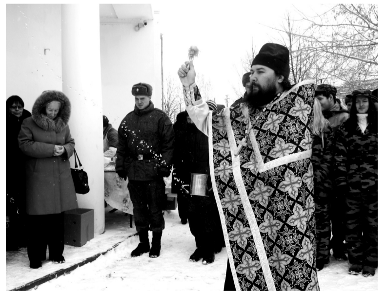
По благословению батюшки – в добрый путь

В задумке организаторов - пройти пешком путь от Верхней до Нижней Салды по старой до-