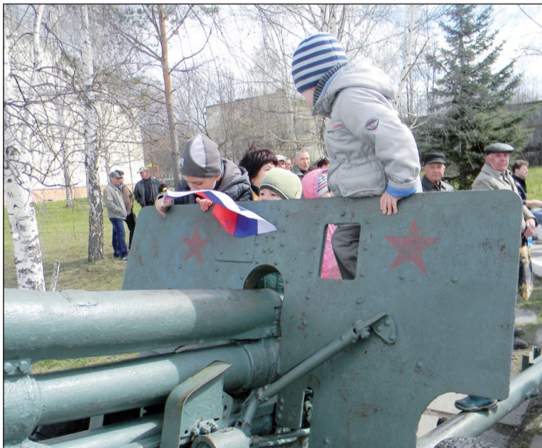
Пушка - теперь «игрушка» для ребятишек