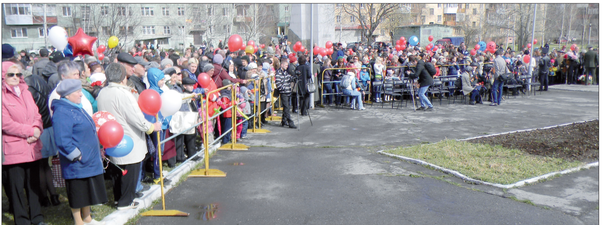
Салдинцы семьями пришли на Праздник Победы, чтобы отдать дань памяти павшим на фронтах Великой Отечественной войны