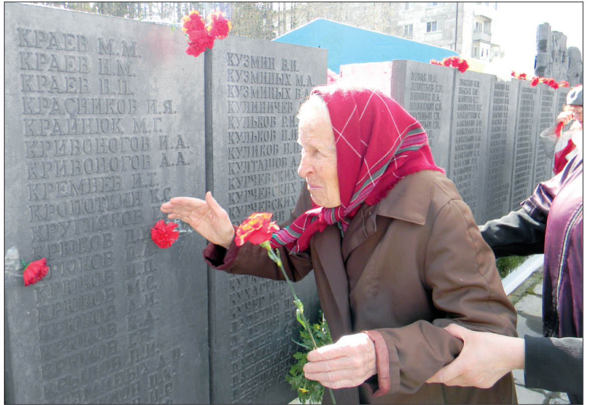
Где-то здесь родная фамилия