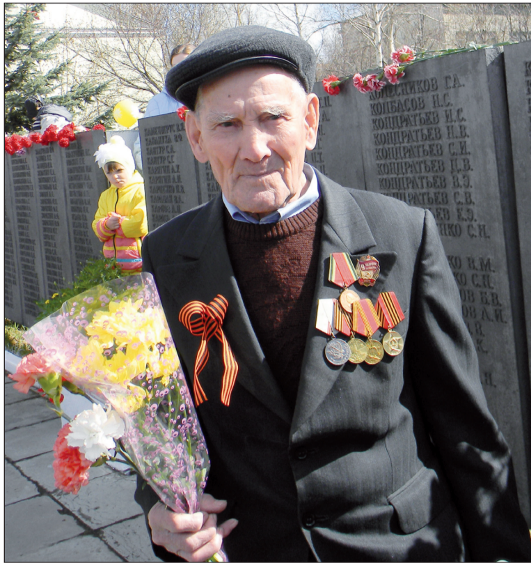
Война оставила свой след на лицах поколений