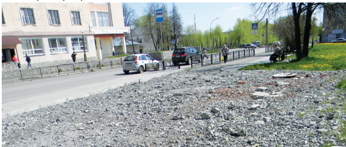
На месте павильона – куча щебня