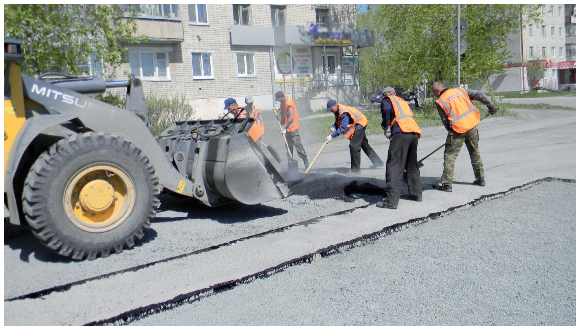
Ремонт дороги на ул. Воронова