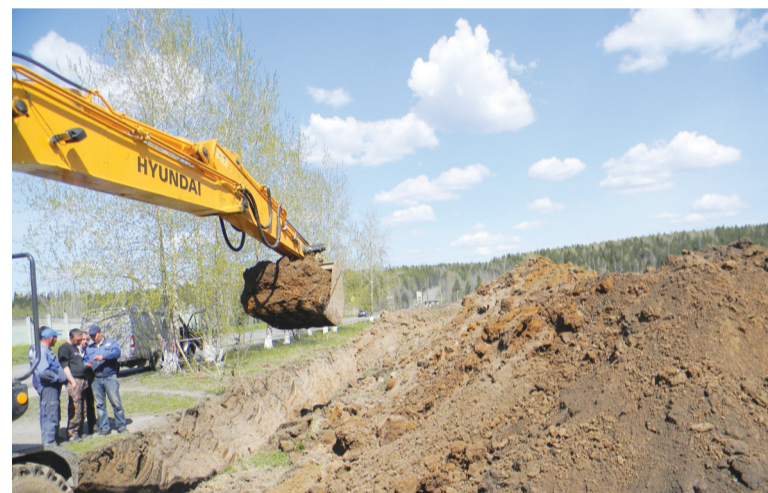
По ул. Парковой тянут газопровод к «Титановой долине»

В конце мая установились теплые дни, правда, с проливными дождями. На улицах города стало несколько оживленней: бригады УЖКХ заняты ямочным ремонтом дорог, специалисты по гидроиспытаниям городских магистралей и подготовке их к предстоящему отопительному сезону работают на трассах тепло- и водоснабжения, дворники метут и чистят территорию на своих участках. Устраняются аварии в местах прорыва водоводов – за 40-50 лет трубы настолько прогнили, что не выдерживают допустимого при испытаниях давления. Ежегодное «латание дыр» вместо замены новыми трубами больших участков теплотрассы руководители коммунальной службы объясняют ограниченными возможностями в денежных средствах. В таких слу-