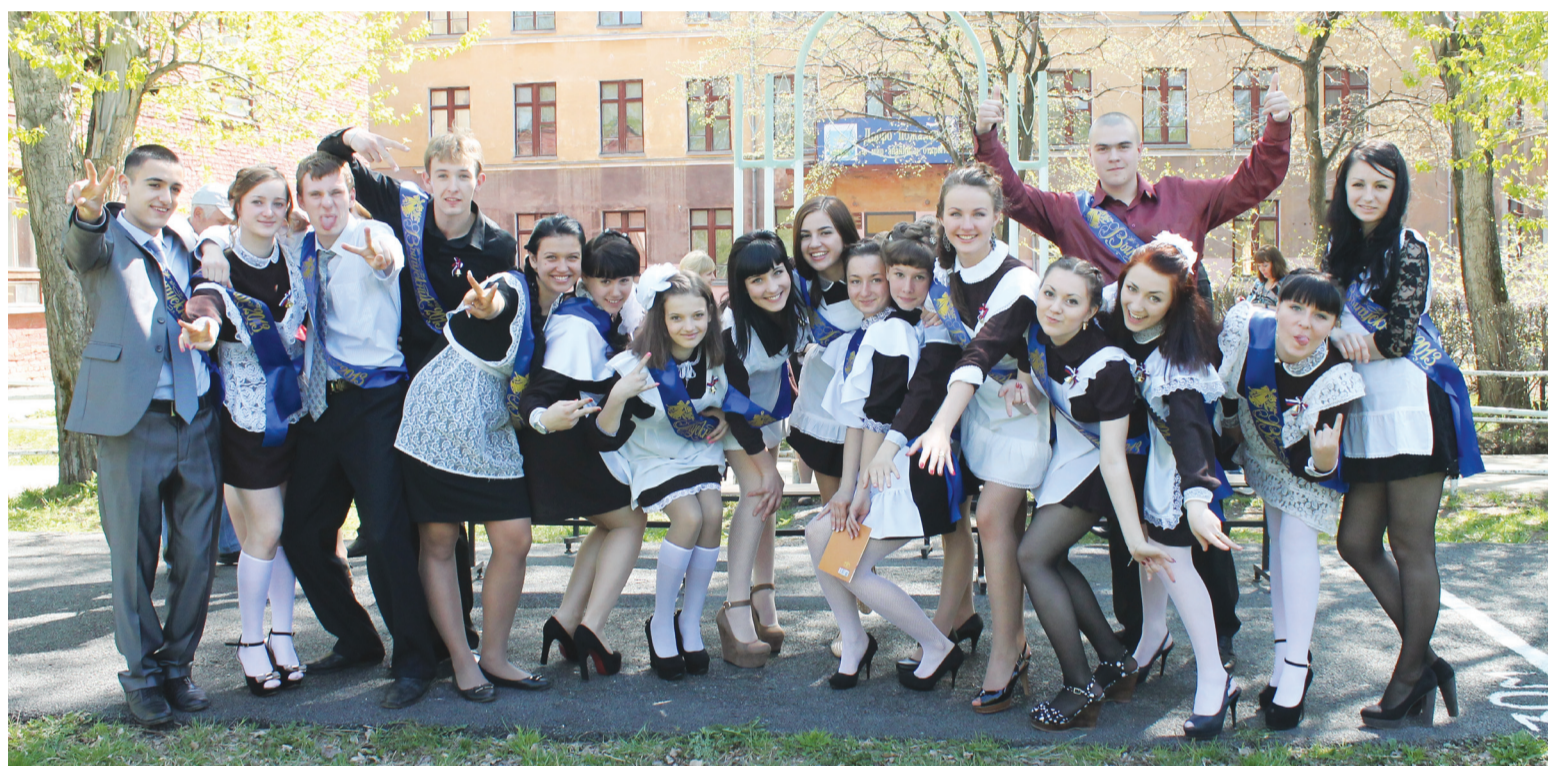
Выпускники школы № 3 счастливы вместе