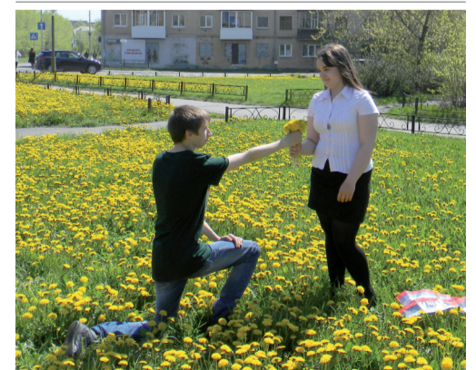
Широкий жест признания