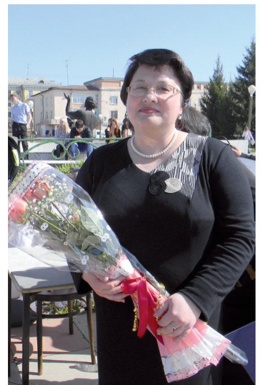
Цветы директору от выпускников