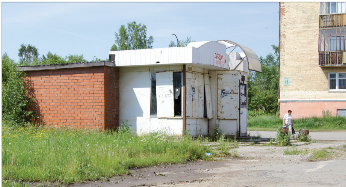
Заброшенный киоск портит вид двора (у магазина «Сделай сам»)