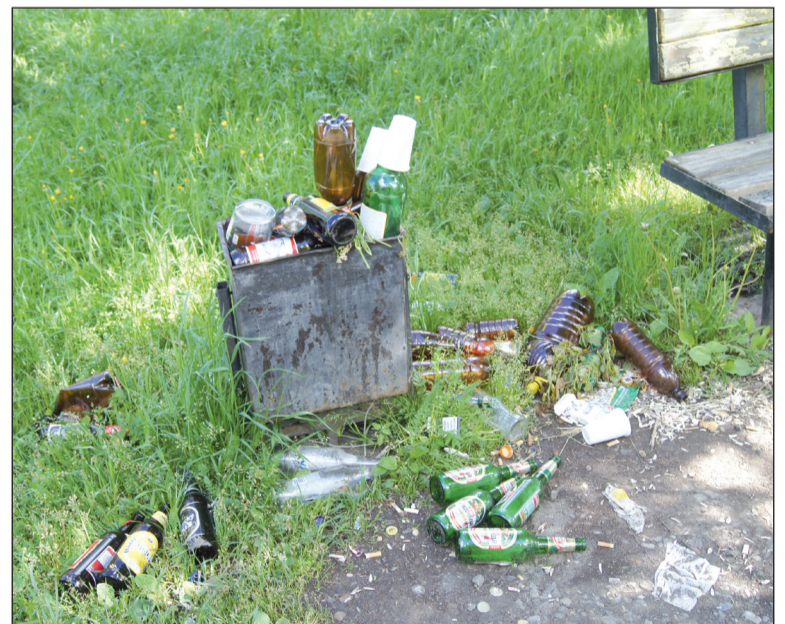
Пьянству – позор!