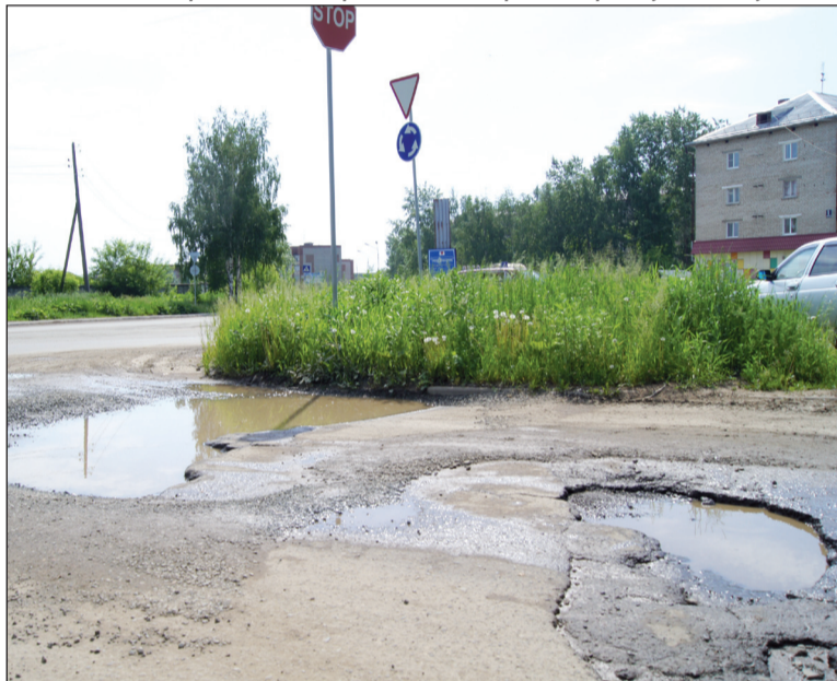
Разбитые дороги – беда В. Салды