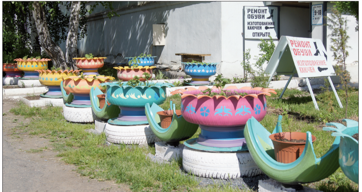
Обувщики обустроили площадку у дома № 87 ул. Энгельса. Вот все бы так делали!