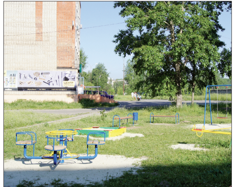
Здесь можно играть детям (двор на ул. Спортивная, 11)