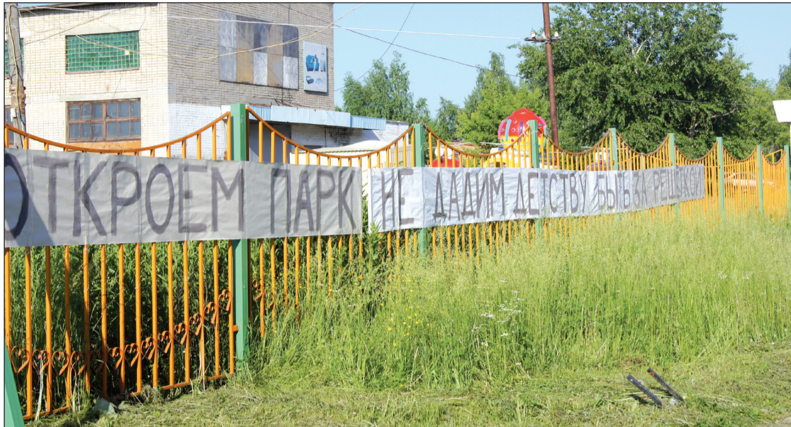
Уже давно не поскрипывают старые качели. В зарослях травы утопают улицы