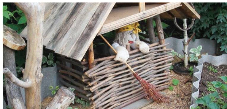
Баба Яга в домике