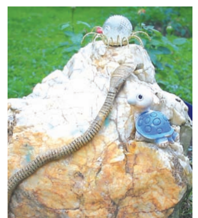
Уральские горы в миниатюре