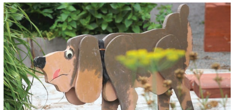
Добрый друг и надежный сторож