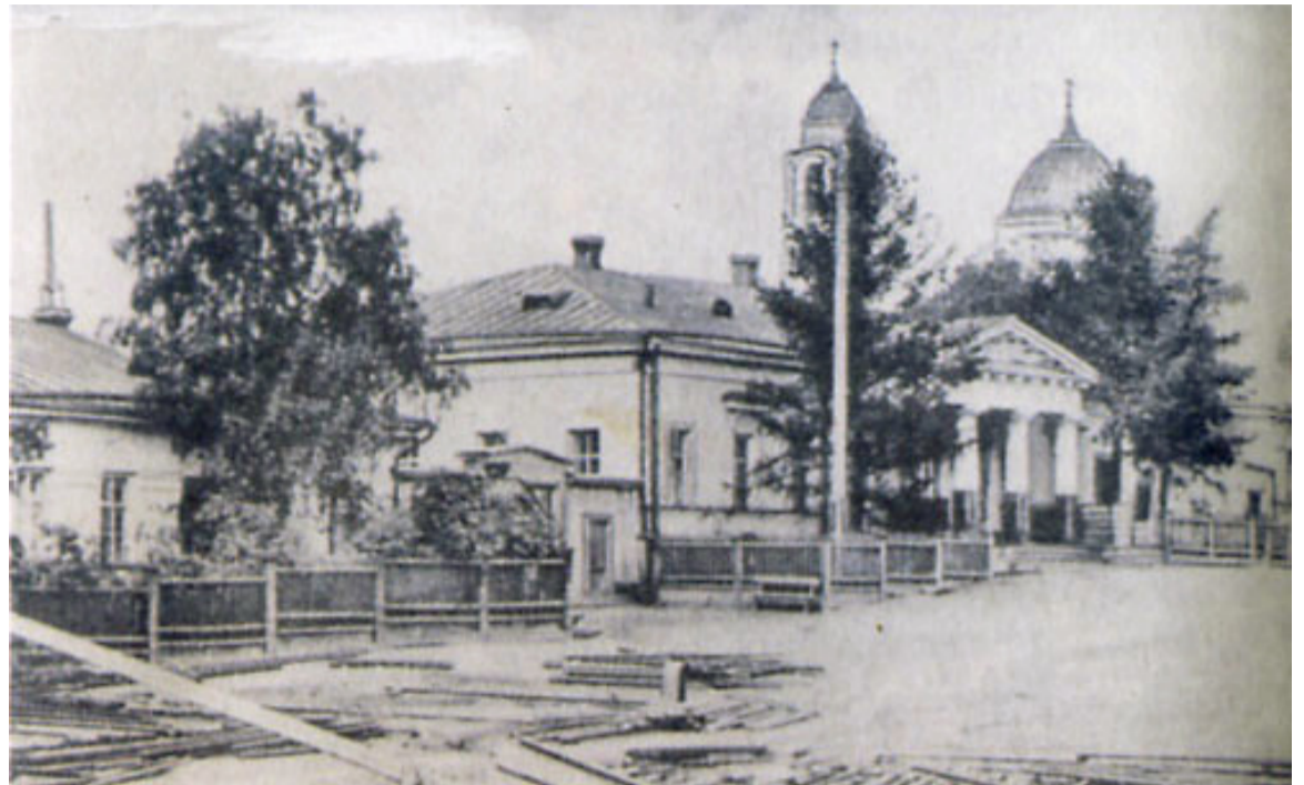
Контора Верхнесалдинского завода. Слева - дом управляющего. В свое время там жил известный металлург В.Е. Грум-Гржимайло

В начале семидесятых здание отдают городской типографии, которая работает здесь до сих пор. В те же годы с южной стороны здания, на месте веранды, строят кирпичный пристрой для редакции