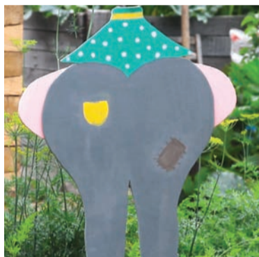
Скульптура «Всегда на грядке»