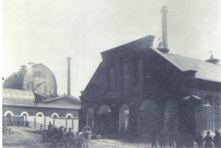
Верхнесалдинский завод. Здание нового мартена