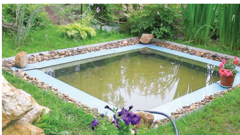
Хорошо у прудика в жаркий день