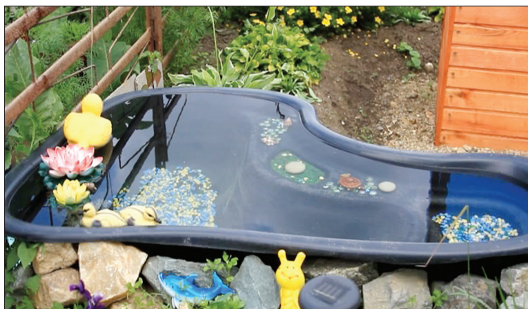
Маленький прудик с прохладной водой