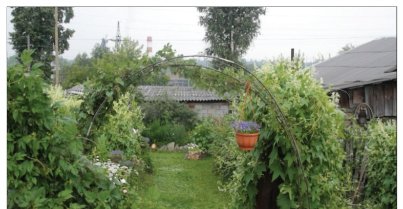
Общий вид сада