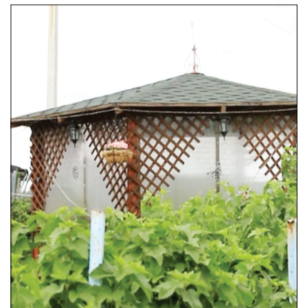
В этой беседке обитает вся семья