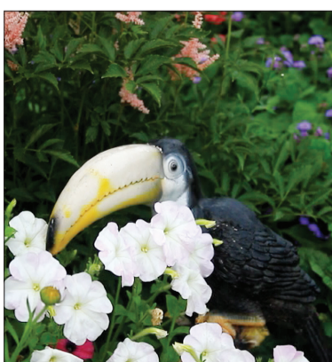
Кеша главный охранник сада