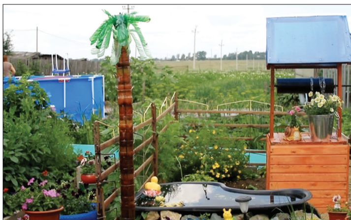
Уютный островок с колодцем