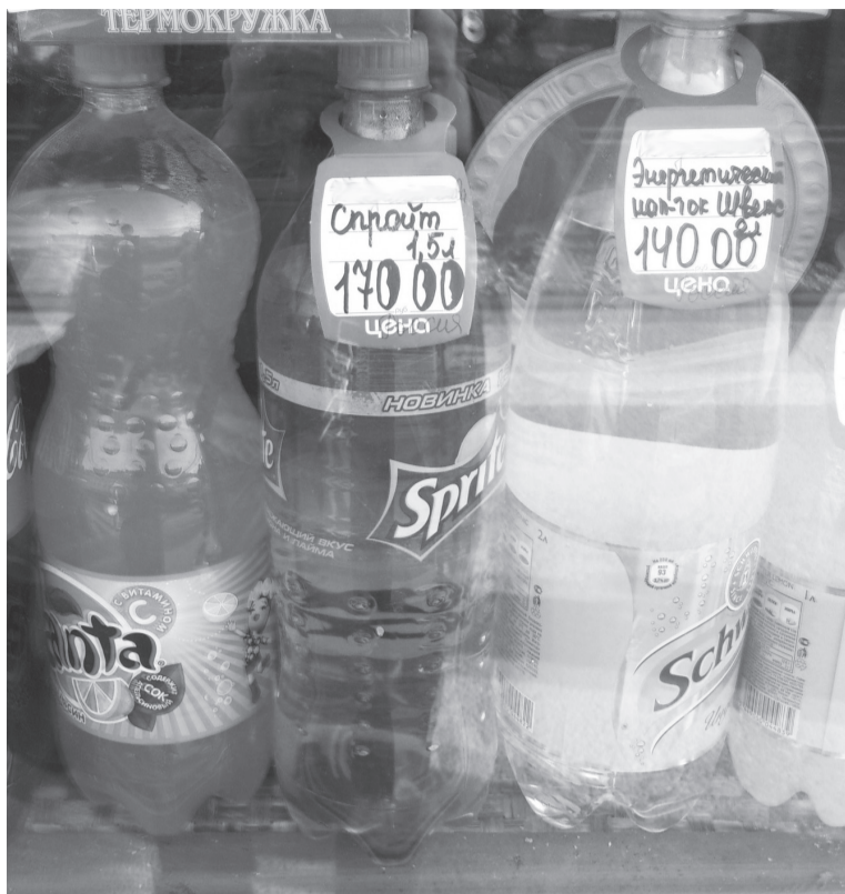
Вокзал, г. Екатеринбург

Мы были в шоке и решили ограничиться необходимым, так как баловство выходило что-то дороговато: сосиски в тесте - 40 руб, пирожки - 30 - 35 руб, полбулки хлеба - 40 рублей, бутылка воды без газа - 80 рублей, полтора литра пива - 180 рублей (в сетевых магазинах оно стоит 65 - 67 рублей). Чтобы сэкономить, пассажиры на больших станциях выходили в город. На перроне Саранска, в киоске, меня поразила картина заплесневевшего гамбургера на витрине и такого же вида рядом лежал пирожок. Интересно, когда их обнаружат? В вагоне проводники предлагали питьевую воду, но почему то, подходя за кипятком, я только два раза