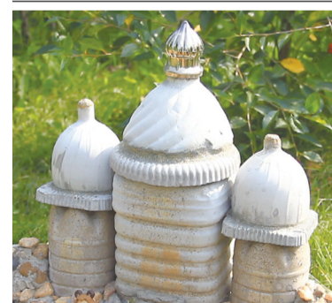
Храм из песка и цемента