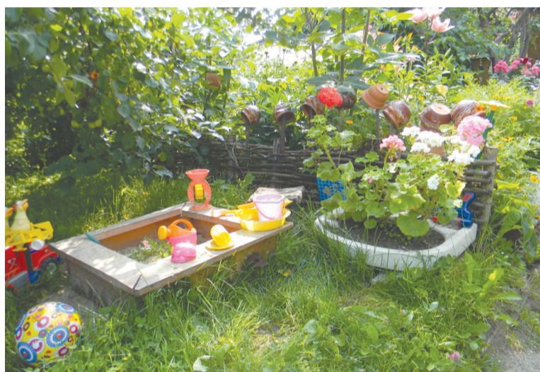
Детская площадка для любимой внучки