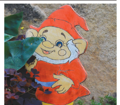
Резные фигурки украшают весь сад