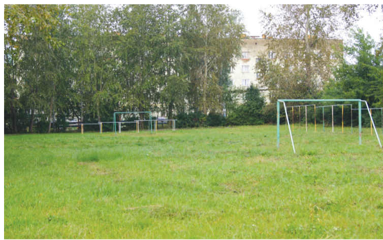
Стадион школы №3

По многолетним наблюдениям специалистов замечено, что сегодняшние учащиеся слабо подготовлены по физкультуре. Тестирование девятиклассников, поступивших в техникум, показывает неутешительные результаты. В беге на 30 метров, в подтягивании, по прыжкам в длину с места не все ребята укладываются в доступный норматив. Объясняется это тем, что в некоторых школах преподавание физкультуры в среднем и старшем звене ведут не профессионалы, а учителя начальных классов. Руководители школ таким способом повышают им зарплату в ущерб качеству занятий. Выводит такой педагог ребят на улицу – и бегайте, дети, вокруг школы, развлекайтесь. Бывает, уроки физкультуры заменяют, например, математикой, в спортзале иногда занимаются по два-три класса. Школьная база по этому предмету напоминает нищего в обноске. Лыжи по нормативу рассчитаны на один год, но ими пользуются дети до тех пор, пока они не сломаются по износу и прямо на лыжне. Спортивный инвентарь не списывается годами и не обновляется. Стадионы в летнюю пору напоминают поскотины, беговые дорожки в потрескавшемся асфальте опасны для занятий – ученик в любой момент может травмироваться. Хорошее современное оборудование требует больших денег, а где их взять? А те, что отпускаются, тратятся на