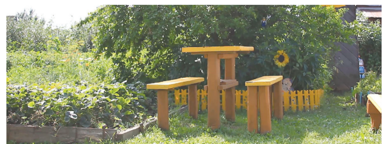
Место, где собираются друзья