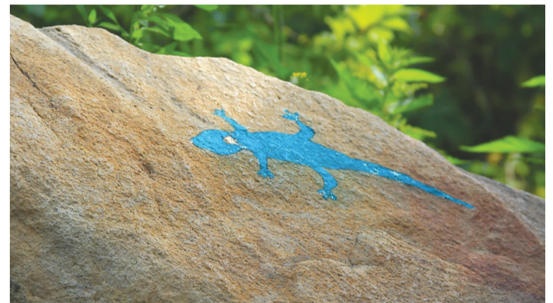
Камень - великан

Татьяна ПУТЕВСКАЯ.