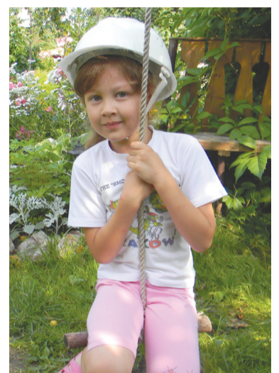
«Тарзанка» для Аленки