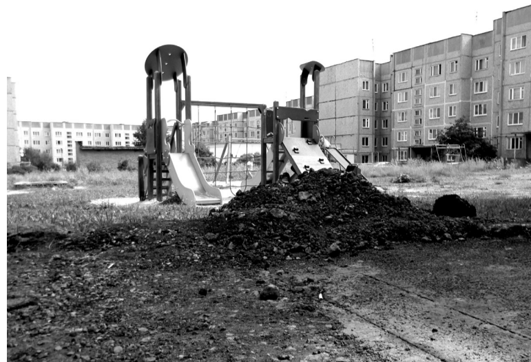
Вид двора после ремонта

Во дворе дома №12 ул. Спортивной бригада дорожной службы УЖКХ недавно «отремонтировала» дворовую дорожку. Надо сказать, что работа выполнена из рук вон плохо. Асфальт закатан небрежно, прямо на бордюры, кучи мусора оставлены на обочине.