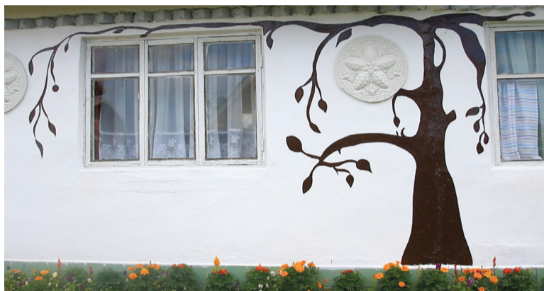
Роспись дома в восточном стиле

Дача семьи Койпыш – восточная сказка, место, где вместе с фонтаном поет душа, и мир становится ярче от огромного подсолнечника, который вырос сам по себе. Вот такое здесь волшебное место!