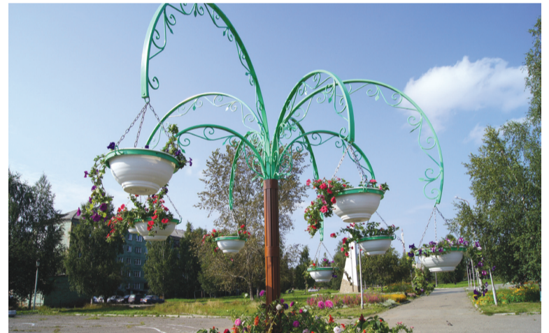
В парке Труда и Победы