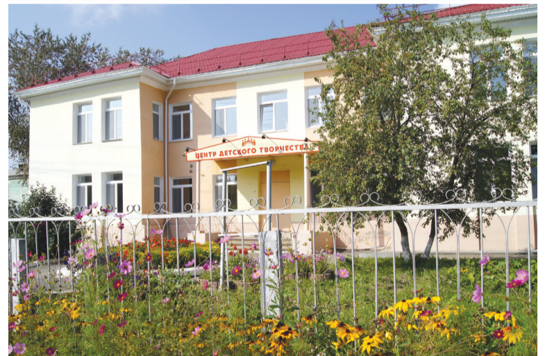
Центр детского творчества утопает в цветах