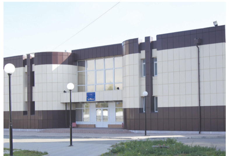
«Крепыш» к услугам детей и взрослых