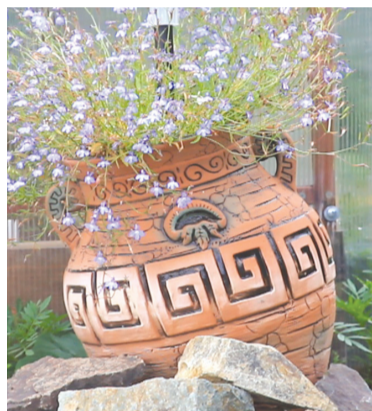
Цветы в античных горшках