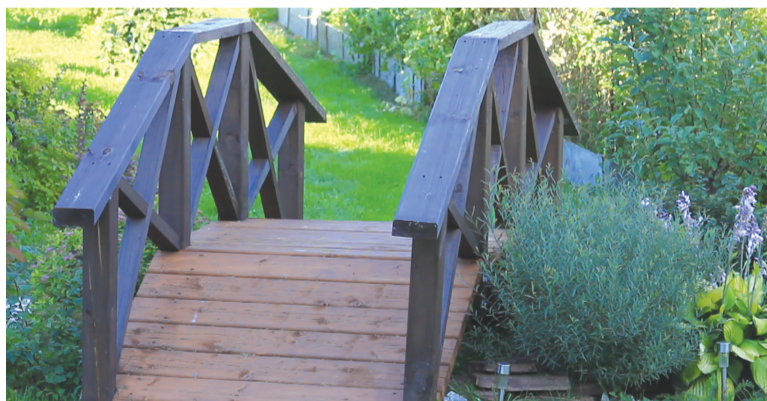
Мостик – яркое украшение сада