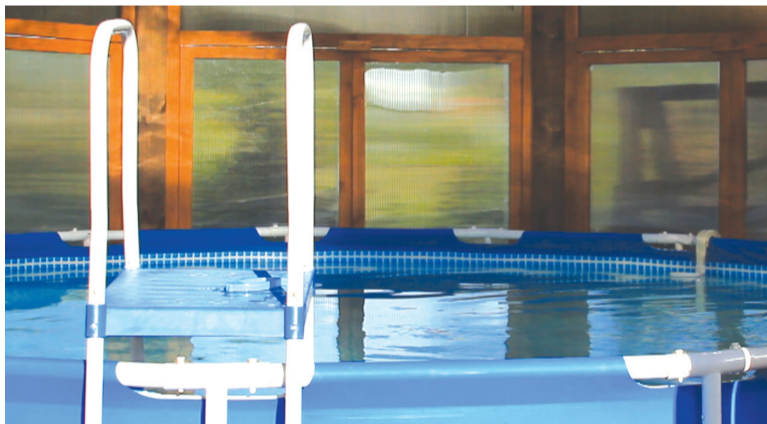
Бассейн, где можно купаться в любую погоду