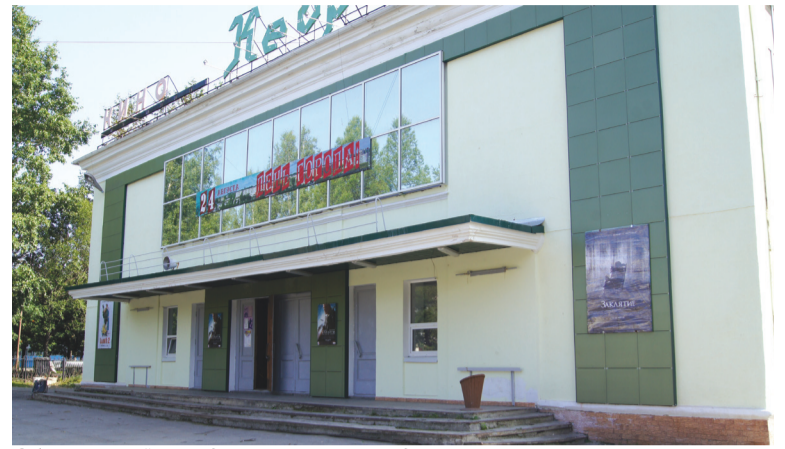
Обновленный фасад кинотеатра «Кедр»