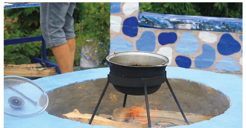
Очаг для приготовления