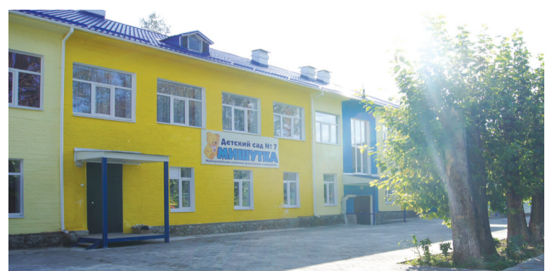
Детский сад «Мишутка» открыт к юбилею