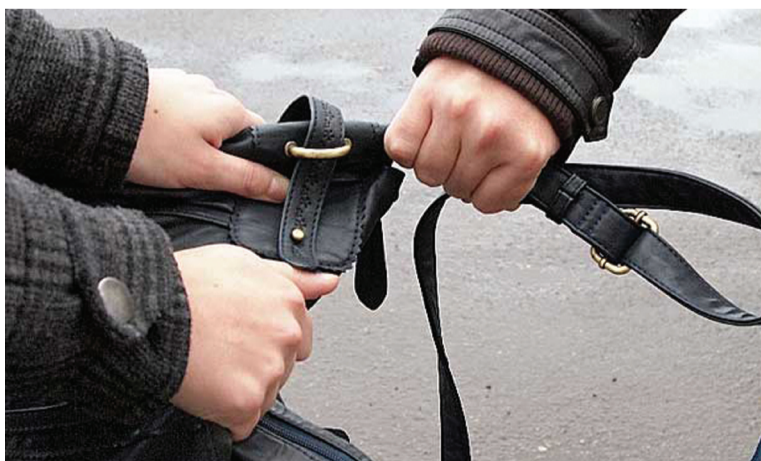
Пресс – служба ГУ МВД России по Свердловской области. г. Верхняя Салда

Теперь ему придется ответить за содеянное по ст. 161 УК РФ «Грабёж», которая предусматривает лишение свободы на срок до четырех лет.