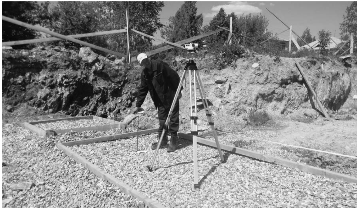
В котловане началась подготовка к бетонированию основания под фундамент