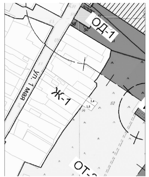
1.4 - земельный участок ул. 1 Мая, кад. номер 66:12:1401001:457 (изменение зоны ОТ2 на зону Ж1) 1.5 - земельный участок ул. 1 Мая, кад. номер 66:12:1401001:459 (изменение зоны ОТ2 на зону Ж1)