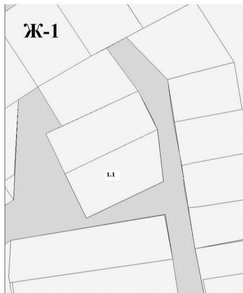
1.1 - земельный участок ул. Лесная (изменение зоны ИТ4 на зону Ж1)