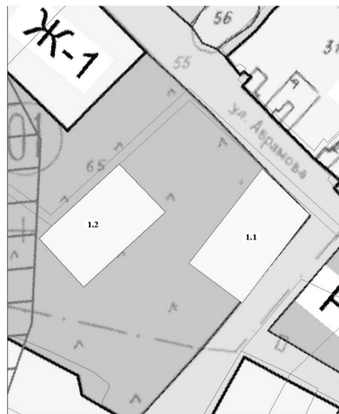
1.1 - земельный участок ул. Абрамова, 16 (изменение зоны Р1 на зону Ж1) 1.2 - земельный участок ул. Абрамова (изменение зоны Р1 на Ж1)