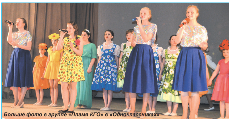
Больше фото в группе «Пламя КГО» в «Одноклассниках»

Порадовали зрителей со сцены не только народные, прославленные хоровые коллективы, но и молодые артисты. Зажига-