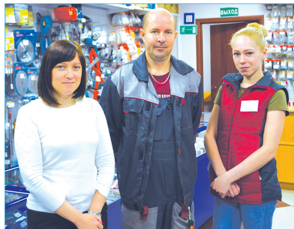
Сотрудники «Строймаркета» готовы вкладывать в работу душу