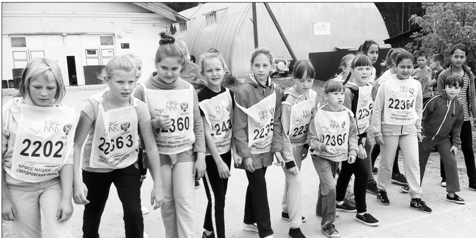
Дети из Позарихи вышли на старт

Главный забег состоялся в столице Урала, где стартовой площадкой стала площадь перед Уральским федеральным университетом. Традиционно в забеге приняли участие команды всех районов областного центра, вузов Екатеринбурга, спортивных семей, иностранных студентов, спортсменов-инвалидов, руководителей области и города. «Кросс нации» является завершающим мероприятием декады бега, которая в сентябре проходит на всей территории Свердловской области. Ежегодно в декаде бега принимают участие более миллиона человек.