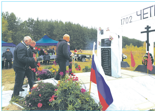
Деревни нет, но люди приезжают на землю, где они родились