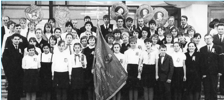
1968 г. Вручение переходящего Красного знамени комсомольцам из Травянского

В комсомольской организации совхоза «Травянский» в 1968 г. насчитывалось 150 человек, это были передовые рабочие, служащие и учащиеся совхоза в возрасте до 28 лет. В честь 50-летия ВЛКСМ нашей передовой комсомольской организации было вручено переходящее