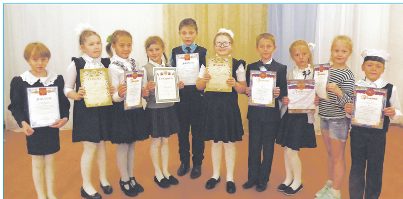
Участники конкурса художественного чтения «Читалочка»