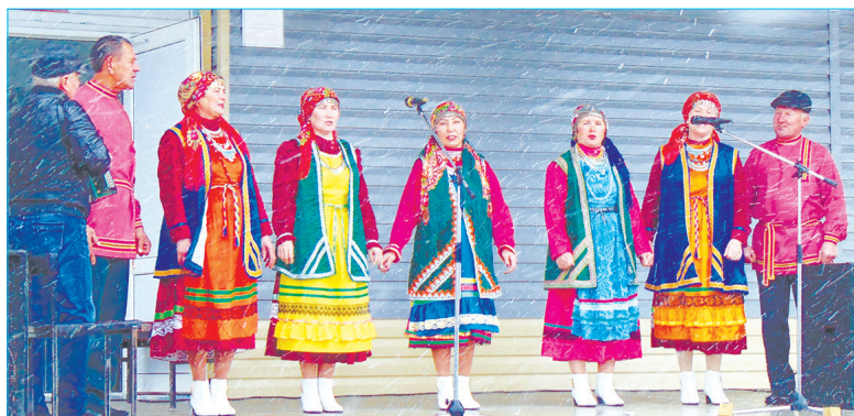
На ярмарке в Сосновском было весело

Вот и 14 октября в центре села шумела ярмарка. Торговые ряды расположились у ДК, среди них веселые скоморохи танцевали и создавали праздничное настроение.