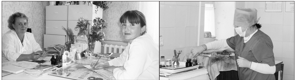
Рабочие будни Каменской ЦРБ

В 2008 г. в ЦРБ запущен новый корпус общей площадью более 2500 кв. м, стоимостью 78 млн. руб., в который закуплено оборудование на 12 млн. руб. Строительство его финансировалось из средств федеральной программы преодоления последствий Восточно-Уральского радиоактивного следа, в зоне которого находится Каменский район. Сейчас в 65-ти его населенных пунктах проживает около 30 тыс. человек.