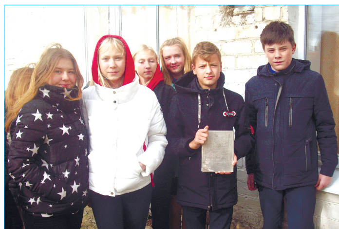
В руках у ребят из Пироговской школы «Капсула времени»

В преддверии 50-летнего юбилея образовательной организации и 100-летия ВЛКСМ было решено достать капсулу. Все присутствующие при этом событии очень волновались, ведь предстояла встреча с историей. Но вот кирпичи под ударом молотка раскололись, и мы увидели плоский контейнер из оргстекла, покрытый пылью. Ребята с нетерпением достали контейнер и вынули из него стальную пластину, на которой выгравировано послание комсомольцев XX века молодежи XXI века. Тут же послание было зачитано притихшим школьникам, которые наяву ощутили дыхание ушедшей эпохи, неповторимую связь времен и поколений.