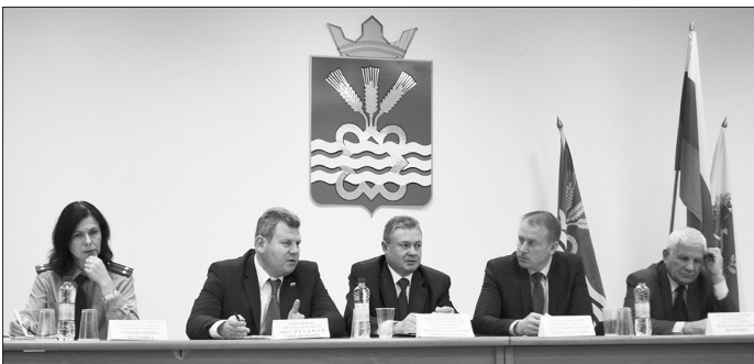
В диалоге профсоюзов с властью важно слышать друг друга

пенсионной реформы, в том числе и повышения пенсионного возраста граждан РФ.