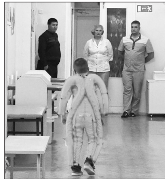
Юным пациентам костюм космонавта нравится

Добавим, подобные медицинские технологии в Каменске появились впервые. Раньше пациентам приходилось ждать от трех до шести месяцев, и подобное лечение можно было получить только в Екатеринбурге, в реабилитационном центре. Теперь эти процедуры можно пройти без выезда за пределы Каменска-Уральского.