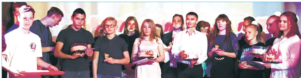
Свою минуту славы получил каждый участник