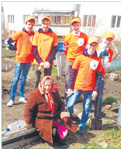
Хороших дел не счесть

- Наша цель – приобщить жителей поселка к добровольческой социально-активной деятельности. В нашем объединении каждый может найти дело по душе и оказать посильную помощь по нескольким направлениям: социальное волонтерство, экологическое и самое популярное среди молодежи – событийное. Чтобы стать умелым добровольцем, каждый месяц участники собираются на «деловое чаепитие со вкусом неформальности». Знакомятся, учатся работать в команде, делятся впечатлениями и обсуждают планы на будущее.