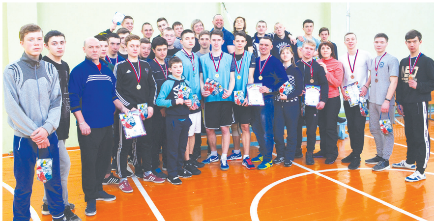
В соревнованиях приняли участие восемь команд

Торжественное построение позади – начались состязания. Разбившись на команды по четыре человека, участники демонстрировали свою готовность к службе в армии. Одно из основных заданий - сборка и разборка на время автомата Калашникова. Наблюдая за действиями будущих воинов, отмечаю – многие из ребят хорошо натренированы. Практически все