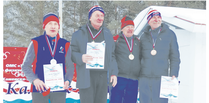
Ветераны на пьедестале почета

шие на массовый старт, который не предполагал гонки на результат. Прогуляться в прекрасную погоду на лыжах – уже удовольствие! Отдельно соревновались школьники до 10 лет, ученики старших классов, ветераны. Свои силы смогли проверить и спортсмены, представляющие разные спортивные секции.