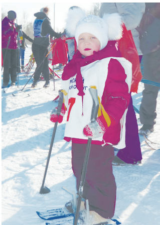
Самая младшая участница забега

В этом году соревнование проходило в пять этапов. Свою приверженность здоровому образу жизни показали руководители – представители администрации и главы территорий, директора предприятий и организаций. Их поддержали участники, вышед-