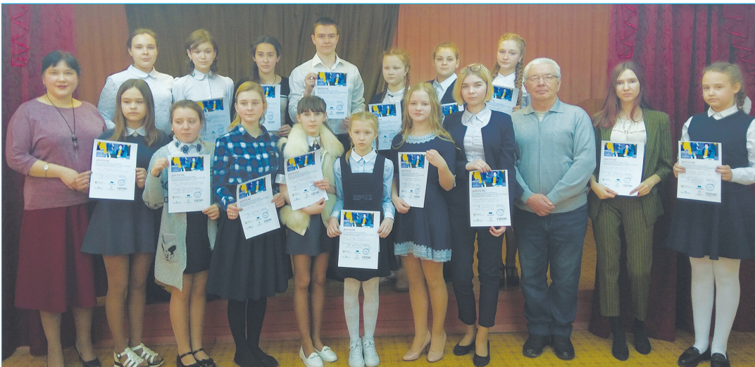
Юные чтецы демонстрировали свою любовь к классической литературе