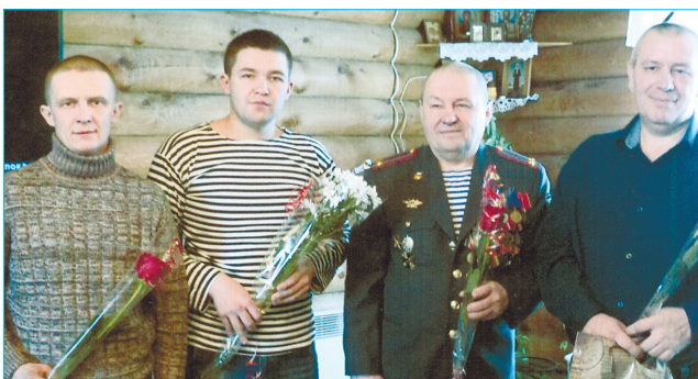
В Барабановском поздравили каждого героя – участника локальных действий

21 февраля в Бродовском клубе прошел праздничный концерт, посвященный мужественным защитникам Отечества.