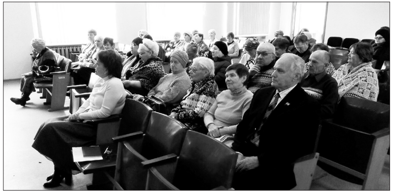
Диалог общественников с представителями районной власти был полезен для всех

Обсуждали ветераны и тему перехода на цифровое телевидение. Заместитель