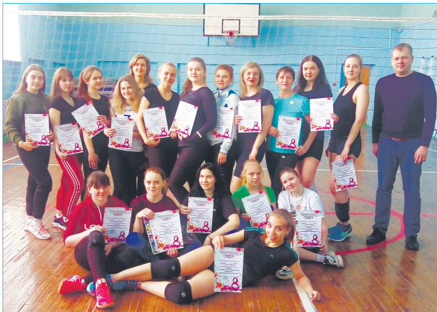
Призеры районного турнира по волейболу среди женских команд