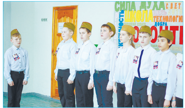
Школьники района показали себя в строевой подготовке