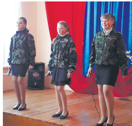
В Травянском ДК мужчин поздравляли маленькие артисты