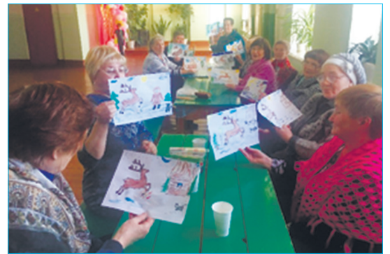
Участники клуба «Золотой возраст» рисовали по мотивам сказа Бажова