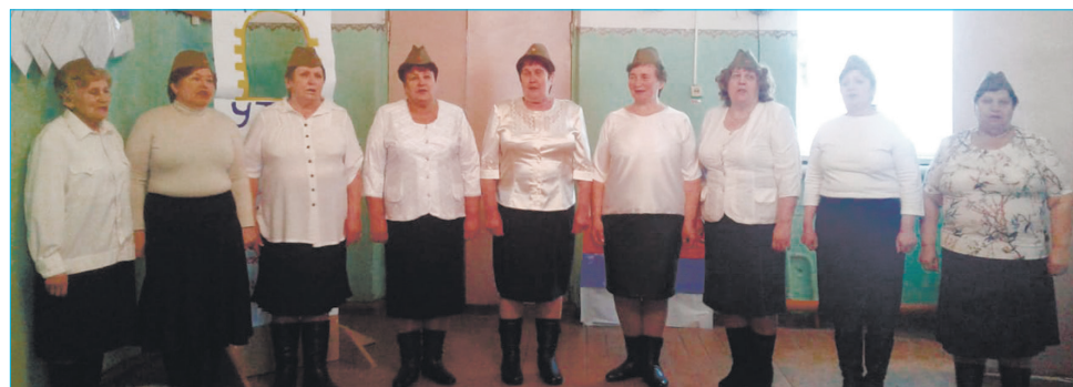
Талантов много в Соколовой