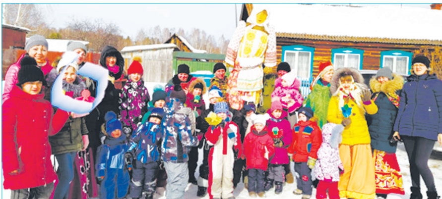
Участники веселой Масленицы в Октябрьском

Гуляния в Травянском прошли у ДК, здесь уже с утра звучали народные песни.