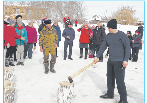
Конкурс «Расколоть колуном дрова»