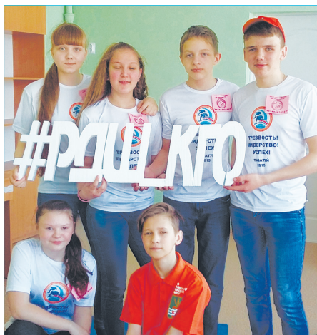
Команда знатоков из Каменского района