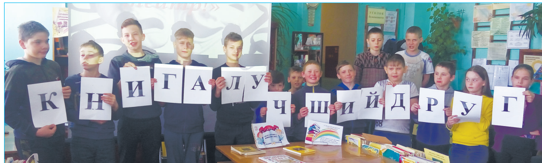
Ребята из Сипавского – активные читатели библиотеки